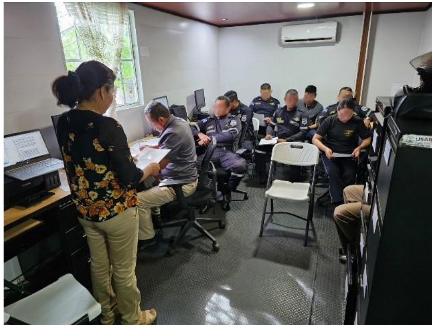
Grupo Focal con personal de la delegación San Vicente.