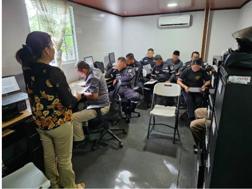
Grupo Focal con personal de la delegación San Vicente.