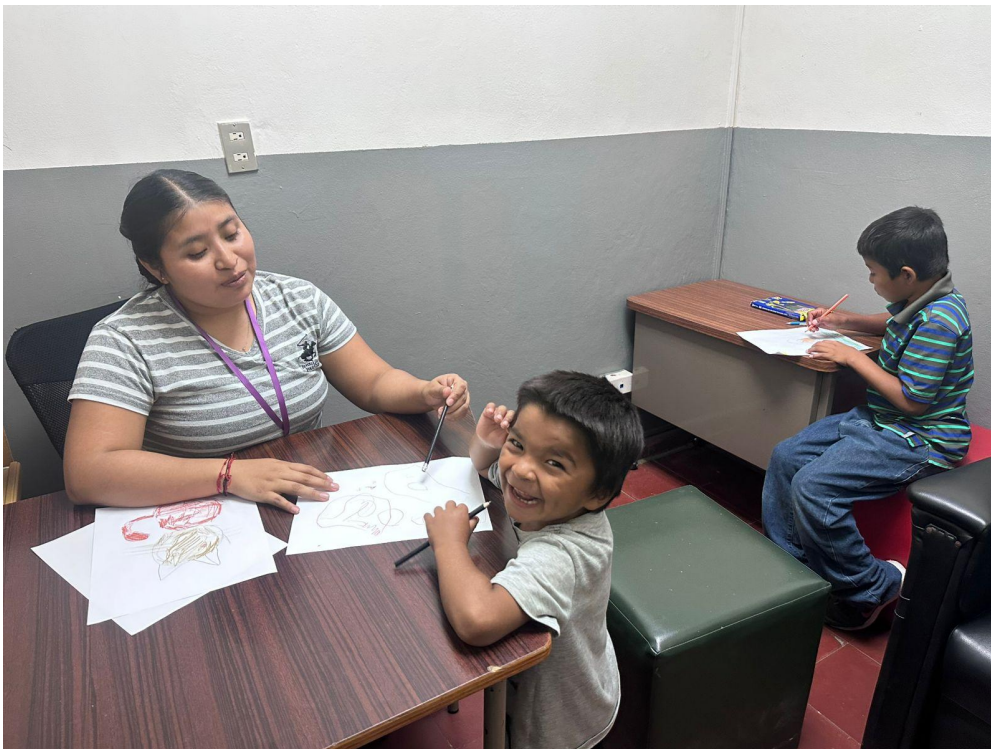
Charlas educativas en centro escolar de Morazán