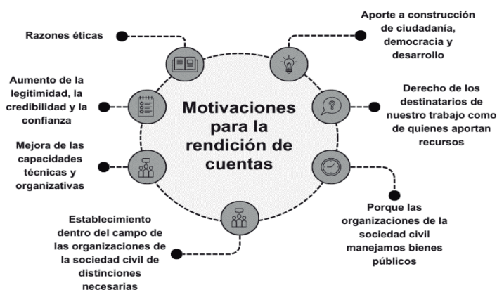
Figura 1. Motivaciones para la rendición de cuentas

Nota. Elaboración propia con base en el Manual para las Organizaciones de la Sociedad Civil: Transparencia, Rendición de Cuentas y Legitimidad.