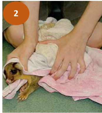
Figura 2. Sujeción de zarigüeya, cabeza y base de la cola inmovilizadas haciendo uso de toalla (Wildlife Heroes, 2021)

que con la otra mano se debe de sujetar la base de la cola, con el objetivo de evitar arañazos con las garras de los miembros posteriores (Figura 3). (Wildlife Heroes, 2021)