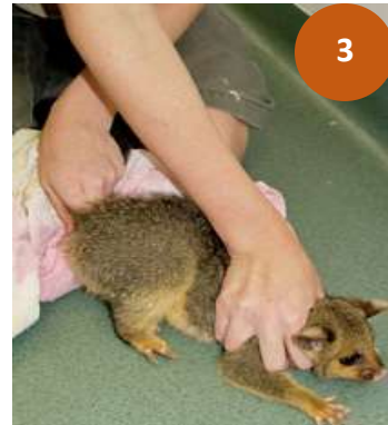
Figura 3. Sujeción de zarigüeya, cabeza y base de la cola inmovilizadas. (Wildlife Heroes, 2021)

Método 2: este método consiste en sujetar la base de la cola del animal y suspenderlo momentáneamente en el aire, pero alejado del cuerpo del operario, luego se envuelve por completo el cuerpo del animal con una toalla, simulando la técnica de “burrito” usada en la clínica de felinos domésticos, a modo de que solamente la cabeza quede libre y el resto del cuerpo totalmente inmovilizado; cuando el animal se encuentre envuelto, se sujeta el cuello con una mano para mantener el control de la cabeza. (Figura 5). (Ortega, A. et al., 2022)