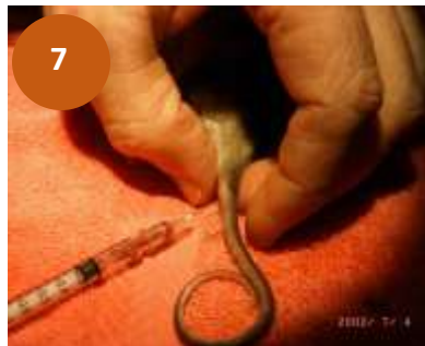
Figura 7. Vena coccígea central en cría de zarigüeya. (Madera, P. 2002)

Se utiliza mayormente la vena coccígea central, se inserta la aguja calibre 27 G en la línea media ventral, perpendicularmente a la cola y se empuja hasta alcanzar las vértebras (Figura 7), luego se retira la aguja lentamente y la jeringa debe de tener retorno sanguíneo. Esta vía es útil en zarigüeyas de todas las edades. (Madera, P. 2002)