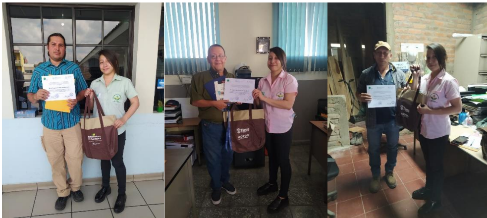
Entrega de diplomas y kits ambientales a participantes del Curso Estratégico de Gestión Ambiental.