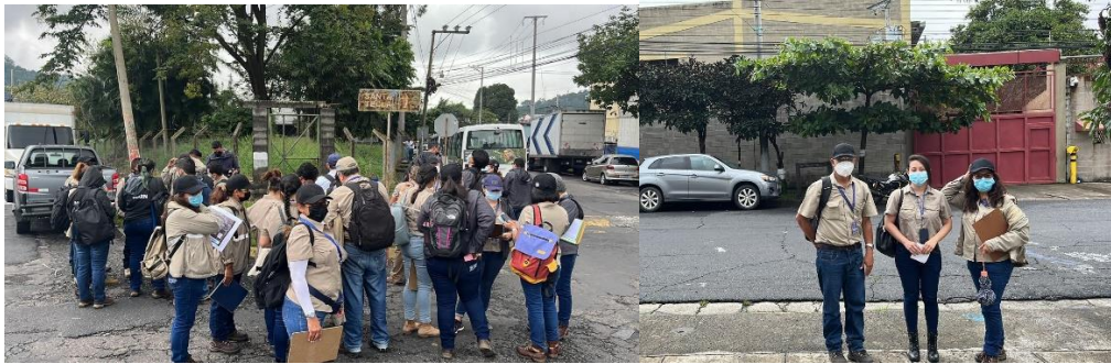
Participación en censo ambiental en el Plan de La Laguna.