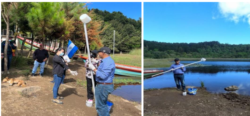
Asistencia a taller de capacitación de las técnicas para muestreo de agua en Laguna Verde, Ahuachapán.