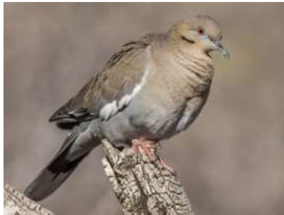
Timmons, J. Zenaida Aliblanca (Zenaida asiatica), adulto . Macaulay Library. eBird.

En ce qui concerne la faune urbaine, bien qu'il n'existe pas de recensements spécifiques dans le cimetière, des études menées dans des espaces verts similaires à San Salvador indiquent une adaptation notable de certaines espèces animales. Par exemple, à l'Université du Salvador, un environnement urbain vert, jusqu'à 100 espèces d'oiseaux ont été identifiées utilisant ces espaces pour se reposer, se nourrir ou nidifier, ce qui démontre leur importance en tant qu'habitat urbain (Redalyc, 2019) 6 .