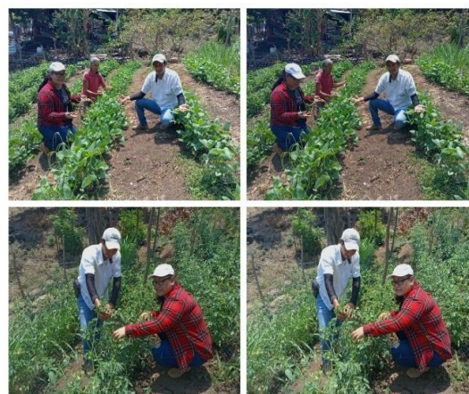
Figura 44. Visita de asistencia técnica a productor beneficiario del proyecto FIDEAGRO.

Visita de asistencia técnica a productor que estableció una granja de 300 pollos de engorde beneficiario por el proyecto FIDEAGRO.