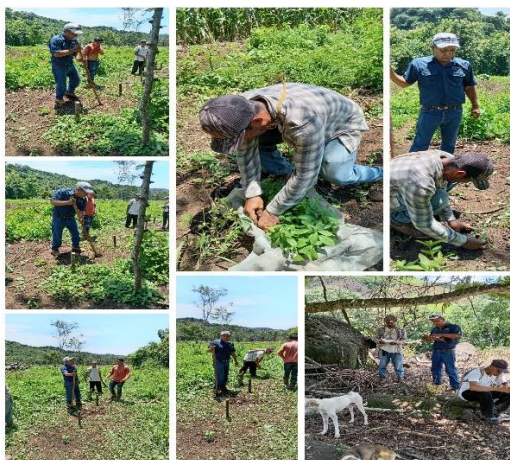
Figura 25. Visita de asistencia técnica a productores de hortalizas en Jujutla, Ahuachapán.

En las visitas de asistencia técnica que se realizaron en hortalizas, frutas y granos básicos, se hacía un recorrido en las parcelas de los productores, en donde se observaron problemas de plagas y enfermedades, y malezas, para luego hacer la recomendación técnica para disminuir, evitar o solucionar el problema que presentaba la parcela. Al finalizar el recorrido se entregaba al productor una hoja de la visita de asistencia técnica con las observaciones en las que se encontraba el lugar y las recomendaciones generales y específicas para mejorar sus cultivos o especies animales.