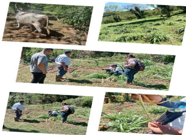
Figura 24. Visita de asistencia técnica a productor de pasto de corte en el cantón Tarpeya, distrito de Tamanique.

Se realizó visita de asistencia técnica a productor que estableció diferentes variedades de pastos de corte (Cuba, Mulato y Mombaza) para alimentación del ganado donde se observó problemas de malezas como gramíneas y de plagas.