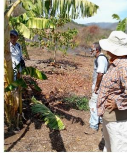
Figura 52. Visita de asistencia técnica a productor de frutales.

Entre las visitas de asistencia técnica emergentes que solicitaban los productores estaban, por ejemplo: los productores de fresa en el distrito de Jujutla en el departamento de Ahuachapán, propietarios de fincas en el cantón El Coyolar distrito de La Libertad Costa, con el objetivo de solucionar problemas de plagas, enfermedades, deficiencias nutricionales, establecimiento y manejo de cultivos, control de malezas, otras.