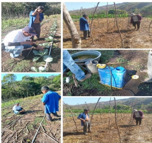
Figura 41. Productor beneficiario del proyecto SIAF en el cantón Buenos Aires, distrito de Tamanique