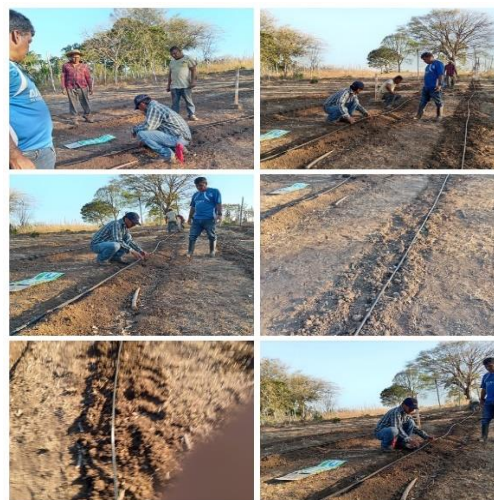
Figura 18. Visita de asistencia técnica a productor de hortalizas en cantón La Shila, Comasagua.