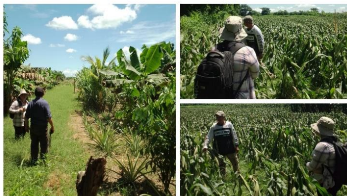
Figura 27. Visita de asistencia técnica a productores excombatientes en el cantón Cangrejera.

Visita de asistencia técnica a pequeños productores de una asociación de veteranos de guerra donde la mayoría tiene cultivo de granos básicos, plátano y pitahaya. Se observó problemas de plagas y enfermedades, mediante la asistencia técnica se hicieron diferentes recomendaciones para mejorar la producción.