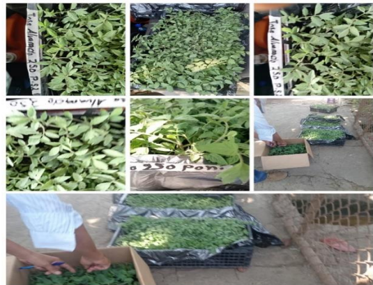
Figura 22. Compra de plantines de tomate y chile dulce en vivero El Plantinero.