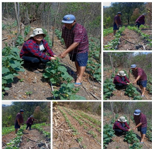
Figura 37. Productor beneficiario del proyecto SIAF en el cantón Buenos Aires, distrito de Tamanique.