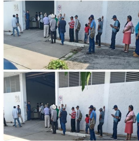
Figura 20. Entrega de fertilizantes a productores.