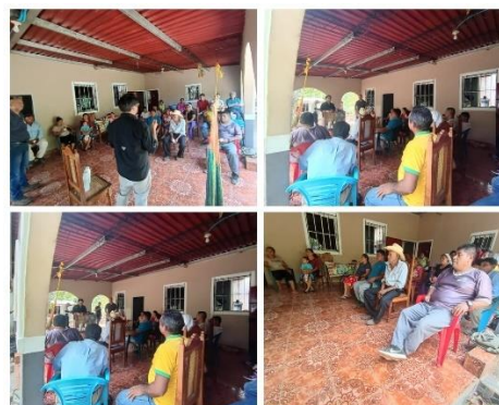
Figura 29. Capacitación sobre productos orgánicos a productores de hortalizas en el cantón El Jobo, distrito de Tamanique.