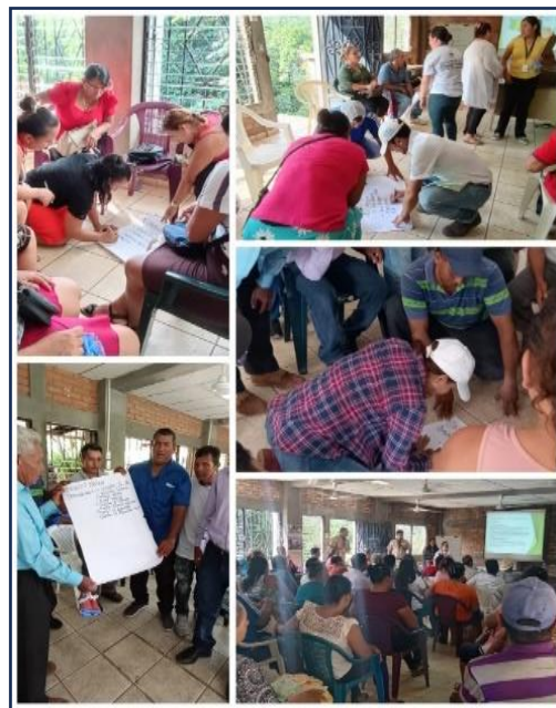
Figura 15. Capacitación de productores sobre Importancia de los productos ecológicos en la agricultura y actualización de datos personales en la alcaldía del puerto de La Libertad en coordinación con ACUA.