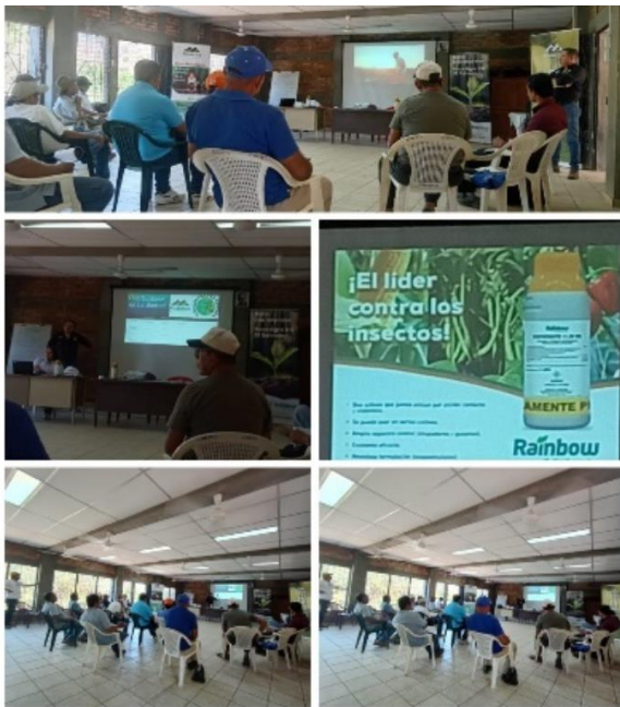
Figura 14. Capacitación sobre Manejo de agroquímicos en hortalizas en CORDES La Libertad Costa.

Participación en la Mesa agropecuaria organizada por CORDES, Banco Mundial, Alcaldía del distrito de La Libertad Costa, CENTA, proyecto Costa Viva, ACUA, productores, instituciones gubernamentales y no gubernamentales, con la finalidad de articular esfuerzos entre todos los actores locales que trabajan en el sector agropecuario de los distritos de La Libertad Costa, Tamanique y Chiltiupán.