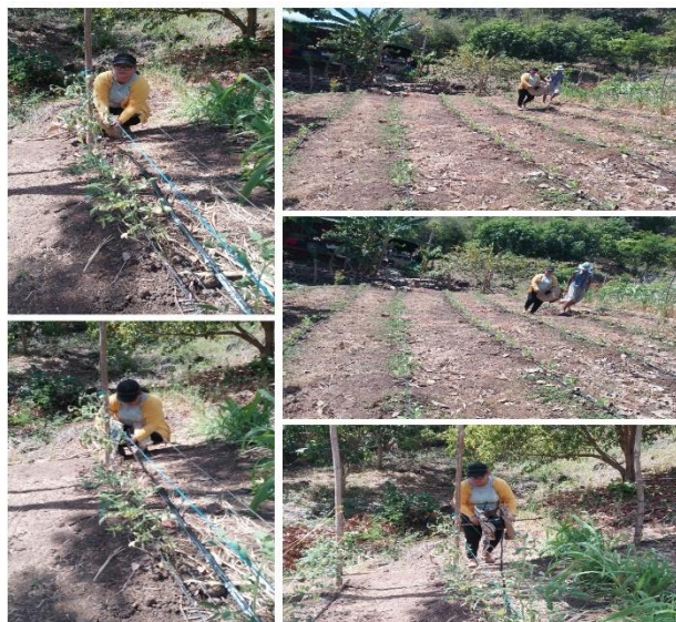
Figura 35. Visita de asistencia técnica a productor beneficiario del proyecto FIDEAGRO en el cantón El Sunzal, Tamanique.

Se beneficiaron a 3 productores (2 hombres y 1 mujer) de la comunidad El Sunzal, distrito de Tamanique, del cantón San Diego, distrito de La Libertad Costa, y del cantón Santa Lucía, distrito de Chilitupán, para fortalecer su emprendimiento a través de la instalación de un sistema de riego por goteo y la siembra de hortalizas.