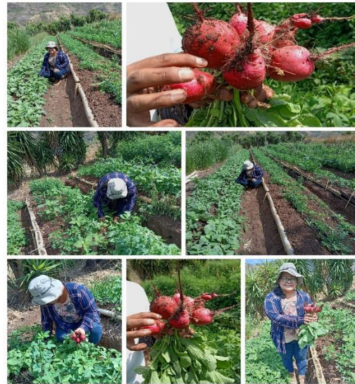
Figura 50. Visita de asistencia técnica a productor de autoabastecimiento de hortalizas.

Las visitas de asistencia técnica tienen un impacto significativo en la mejora de las prácticas agrícolas y en la rentabilidad de los productores, porque permite dar un apoyo continuo y hacer seguimiento para garantizar que los productores no solo se adapten a cambios temporales, sino también realicen la mejora de los suelos para obtener un alimento más sano y nutritivo.