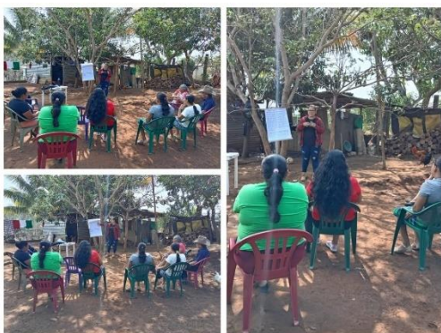
Figura 28. Capacitación sobre abonos verdes a productores del casco urbano del distrito de Tamanique.

Se impartieron capacitaciones a productores(as) del distrito de Tamanique, Chiltiupán y La Libertad Costa sobre Manejo integrado de plagas, Abonos verdes, Manejo postcosecha y Manejo de productos químicos y orgánicos.