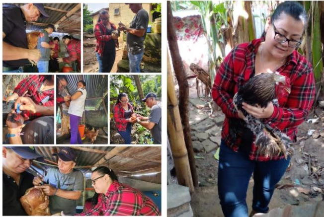
Figura 6. Vacunación de aves de corral para prevenir el Newcastle en el distrito de Huizúcar.

Se realizó una campaña de vacunación de aves de corral para prevenir la enfermedad del Newcastle, a través de la cual se apoyó a productores del distrito de Huizúcar, donde se aplicó una gota de la vacuna en uno de los ojos de cada ave, con un total 15 productores (10 hombres y 5 mujeres) y un total de 412 aves vacunadas.