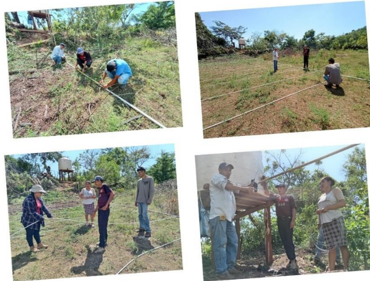
Figura 33. Productor beneficiario del proyecto SIAF.