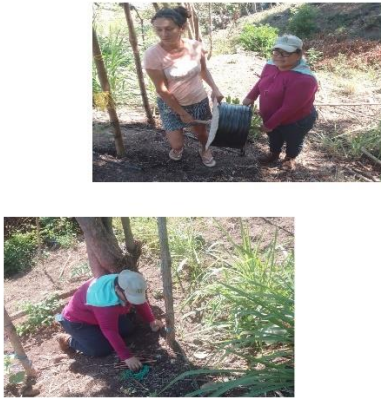
Figura 7. Instalación de sistema de riego por goteo a productora beneficiaria del proyecto FIDEAGRO en distrito de Tamanique.