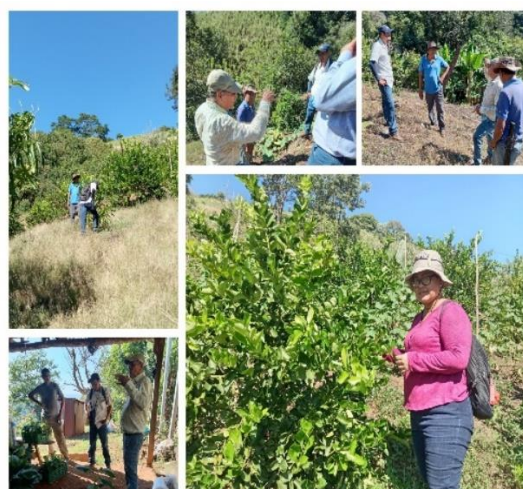
Figura 42. Productor beneficiario del proyecto SIAF en el cantón Santa Marta, distrito de Tamanique.