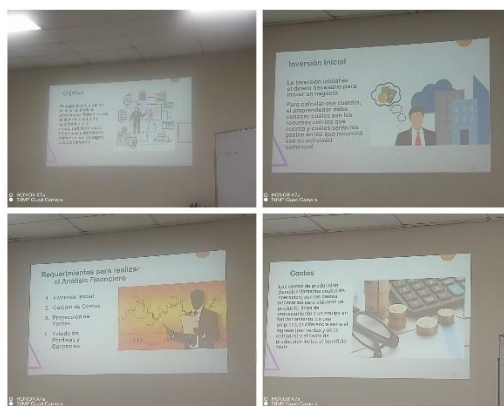
Figura 47. Capacitación sobre Formación y fortalecimiento de capacitación del equipo técnico de CENTA.