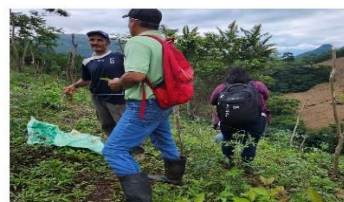
Figura 40. Productor beneficiario del proyecto SIAF en el cantón El Jobo, distrito de Tamanique.

El propósito de verificar el manejo de las plagas y enfermedades en los cultivos de hortalizas de los productores beneficiarios del proyecto SIAF es para que tengan menos pérdidas a través de las buenas prácticas agronómicas.