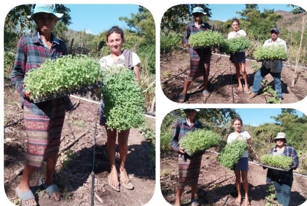
Figura 36. Entrega de plántulas de tomate a productora beneficiaria por CENTA.