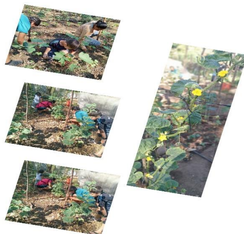
Figura 32. Escuela de Campo en el cantón El Sunzal, distrito de Tamanique.