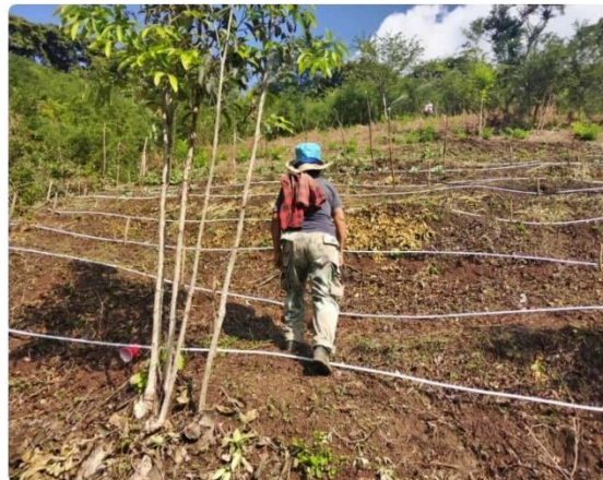
Figura 10. Visitas de seguimiento y monitoreo en el proyecto SIAF.