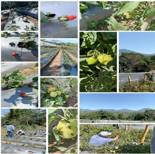
Figura 53. Visita de asistencia técnica a productor de cultivo de fresa en Jujutla, Ahuachapán.

Entre las visitas de asistencia técnica emergentes que solicitaban los productores estaban, por ejemplo: los productores de fresa en el distrito de Jujutla en el departamento de Ahuachapán, propietarios de fincas en el cantón El Coyolar distrito de La Libertad Costa, con el objetivo de solucionar problemas de plagas, enfermedades, deficiencias nutricionales, establecimiento y manejo de cultivos, control de malezas, otras.