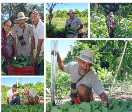
Figura 43. Visita de asistencia técnica a productor beneficiario del proyecto FIDEAGRO.

Se realizó visita de monitoreo a los productores de hortalizas beneficiarios del proyecto FIDEAGRO en los distritos de Tamanique, La Libertad Costa y Chilitupán, donde cada productor implementó su emprendimiento, obtuvo resultados favorables y mejoró su rentabilidad.