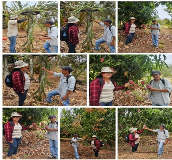
Figura 54. Visita de asistencia técnica a productor comercial de frutas en comunidad El Coyolar, La Libertad Costa.