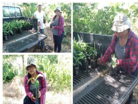
Figura 12. Entrega de plantas de plátano Cuerno enano para productores beneficiarios por la agencia del CENTA.