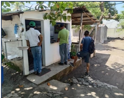
Figura 21. Compra de plantines de tomate variedad Pony y variedad 250 P.52 en el vivero “Pilonero El Nuevo Dia”.

Se realizó la compra de plantines de tomate de la variedad Pony y del híbrido 250 P.52 en el vivero “Pilonero El Nuevo Dia”, con productores que solicitaron este servicio, donde CENTA ofrece el servicio de transporte en el pick up 4x4 para trasladar los plantines y a los productores.