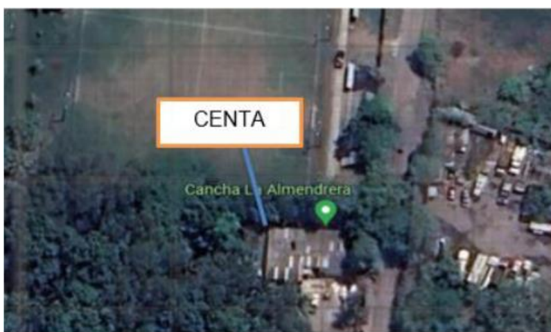
Figura 1. Ubicación de la oficina del CENTA Puerto de La Libertad (Google Earth 2024).

La oficina de la agencia de extensión de CENTA del distrito de La Libertad Costa está ubicada en la playa Conchalío, en el Puerto de La Libertad, en el departamento de La Libertad, con coordenadas geográficas de Latitud Norte 13°48'84.14", Longitud Oeste 89°33'24.33" y una elevación de 1,200 metros sobre el nivel del mar (msnm).