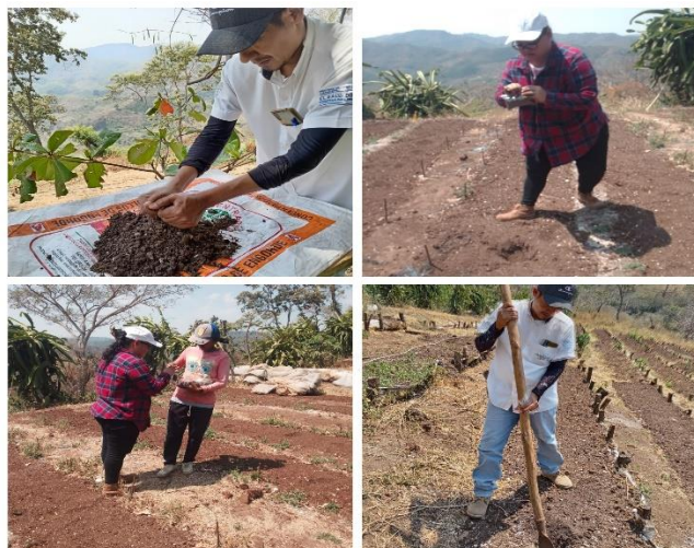
Figura 51. Visita de asistencia técnica a productor de hortalizas.

Las visitas de asistencia técnica tienen un impacto significativo en la mejora de las prácticas agrícolas y en la rentabilidad de los productores, porque permite dar un apoyo continuo y hacer seguimiento para garantizar que los productores no solo se adapten a cambios temporales, sino también realicen la mejora de los suelos para obtener un alimento más sano y nutritivo.