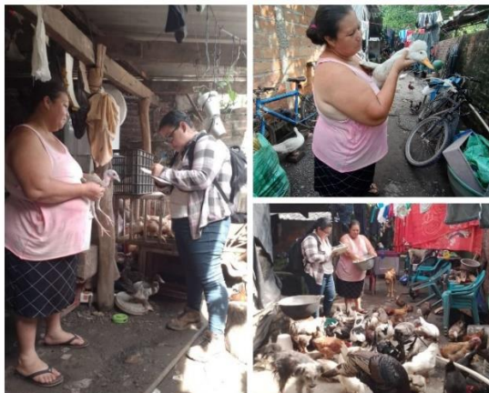
Figura 23. Visita de asistencia técnica a productora de aves de corral en el cantón Melara, distrito de La Libertad Costa.

a productores de hortalizas, frutales, aves de corral, entre otros. Se realizó visita de asistencia técnica a productora de aves de corral en el cantón Melara del distrito de La Libertad Costa donde se le recomendó realizar una aplicación de vitaminas y antibiótico.