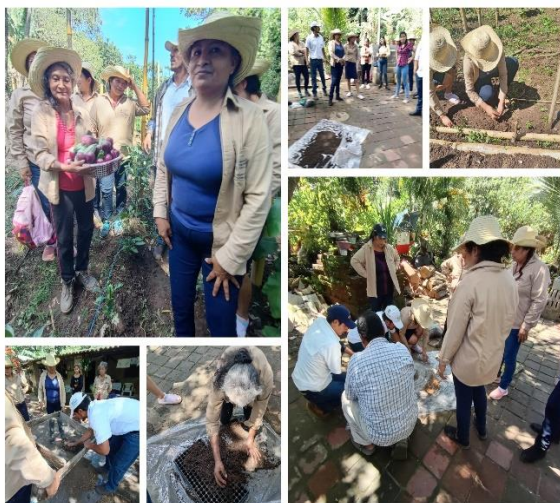
Figura 31. Escuela de Campo en el cantón Amaquilco, distrito de Huizúcar.

A través de la metodología “Aprender haciendo” impartida por CENTA, Ciudad Mujer y la alcaldía del distrito de Huizúcar, se capacitaron a un total de 130 productores (32 hombres y 98 mujeres), y en el distrito de Tamanique a un total de 85 productores (10 hombres y 75 mujeres). Se mejoró la producción de hortalizas a través de la transferencia de tecnologías realizada en las escuelas de campo y en el establecimiento de parcelas demostrativas en los distritos de Huizúcar y Tamanique.