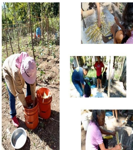
Figura 4. Escuela de Campo en el cantón El Sunzal en distrito de Tamanique.