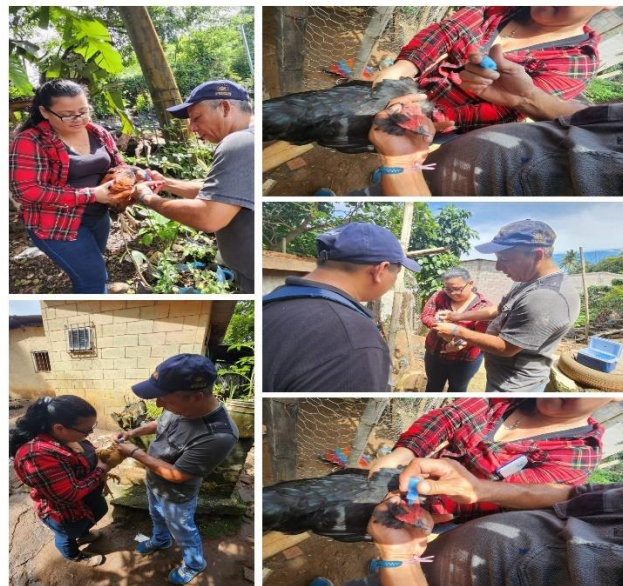
Figura 34. Campaña de vacunación de aves de corral para control de Newcastle en el distrito de Huizúcar.

Se brindó apoyo en la aplicación de 412 dosis de vacunas para aves de corral, beneficiando a 12 productores, 8 hombres y 4 mujeres, del distrito de Huizúcar con el objetivo de prevenir la enfermedad del Newcastle.