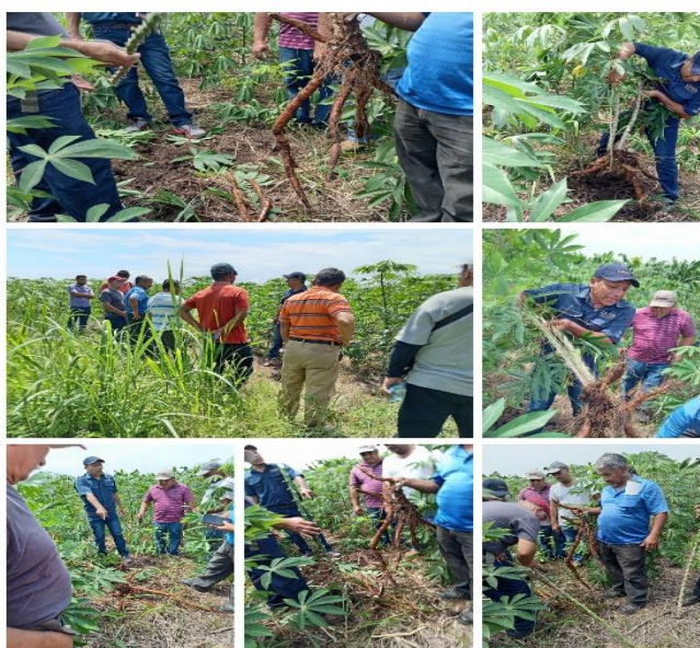
Figura 13. Capacitación sobre Manejo del cultivo de yuca en Cangrejera distrito de La Libertad Costa.