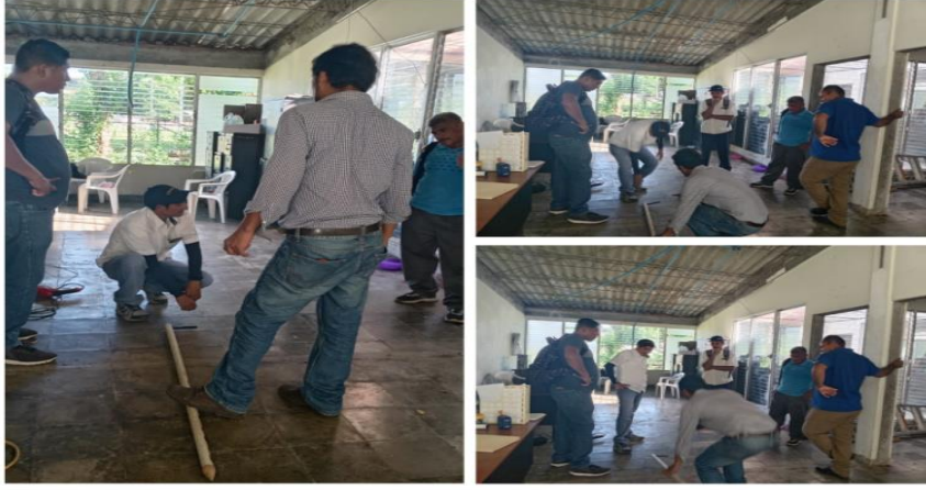
Figura 5. Entrega de sistema de riego por goteo a productores beneficiarios del proyecto SIAF y capacitación sobre la instalación en la agencia CENTA La Libertad.