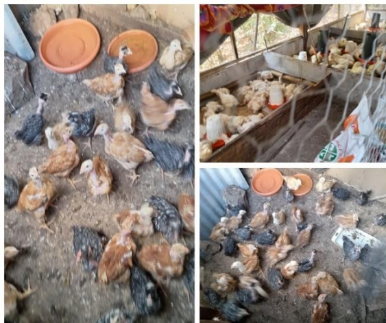
Figura 45. Visita de asistencia técnica a productor beneficiario del proyecto FIDEAGRO en el cantón Santa Lucía, Chiltiupan.