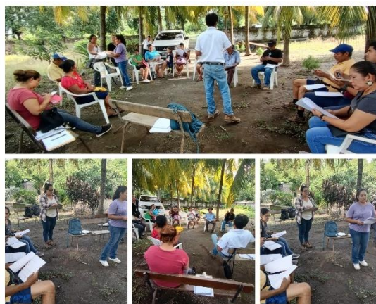
Figura 48. Reunión de Mesa Agropecuaria sobre el manejo agronómico de los cultivos de hortalizas y frutales en el cantón San Diego distrito de La Libertad Costa.

La participación en las actividades organizadas por la Mesa agropecuaria permitió adquirir nuevos conocimientos durante la formación profesional como el manejo agronómico de los diferentes cultivos y las plagas que afectan en la zona costera y en la zona alta.