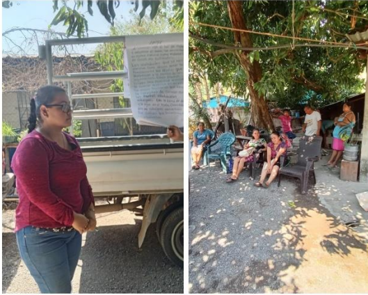
Figura 55. Capacitación sobre Abonos verdes a productores de hortalizas en cantón El Izcanal, Tamanique.

Se brindó apoyo en 15 jornadas de capacitación con una participación de 233 personas, 144 hombres y 89 mujeres, de los distritos de Chiltiupán, Tamanique y La Libertad Costa, para mejorar las prácticas agrícolas sostenibles y aumentar la producción en el campo.