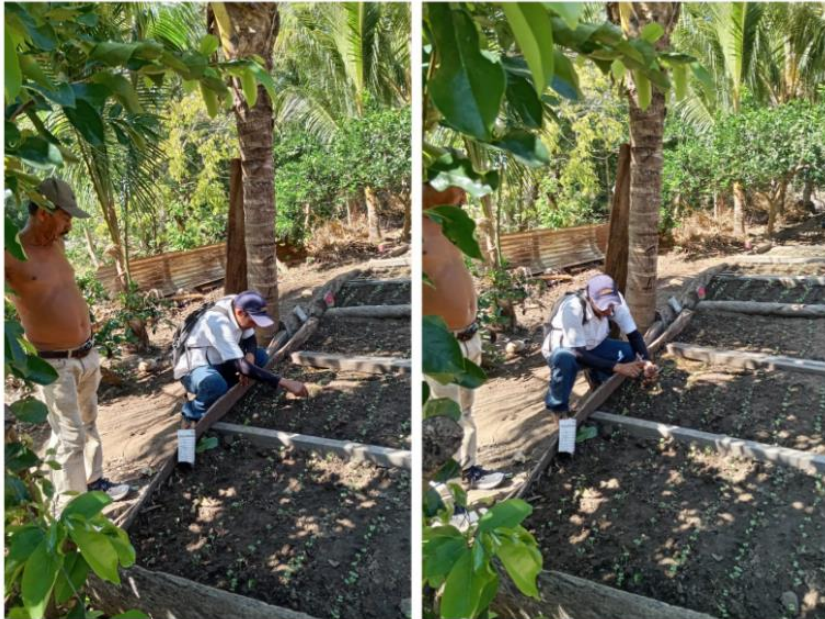
Anexo 21. Visita de asistencia técnica a productora de hortalizas beneficiaria por FIDEAGRO en El Izcanal, Tamanique.