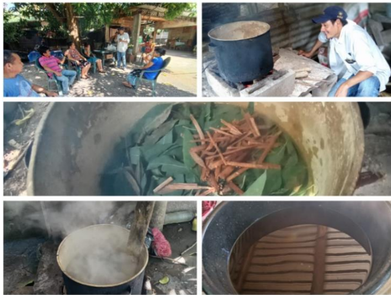
Anexo 19. Escuela de Campo en El Sunzal, Tamanique, en coordinación con Ciudad Mujer.