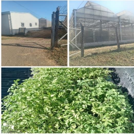
Figura 19. Entrega de plantines de tomate a productora.