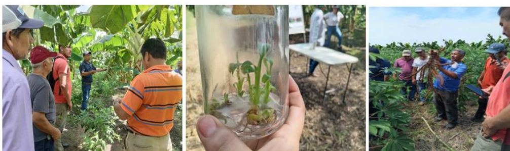
Figura 46. Capacitación sobre Manejo de Plátano y cultivo de yuca en Cangrejera distrito de La Libertad Costa.

Participación en gira de campo con productores en finca agroecológica donde tienen una parcela demostrativa de cultivo de plátano variedad Cuerno enano y una parcela de yuca variedad Quezaltepeque, en donde implementaron tecnologías como: plantación sana resistente a plagas y enfermedades, lo cual permitió mejorar sus sistemas de producción y productividad a bajo costo, con el objetivo que los productores conozcan, observen los resultados y los pongan en práctica en sus parcelas.