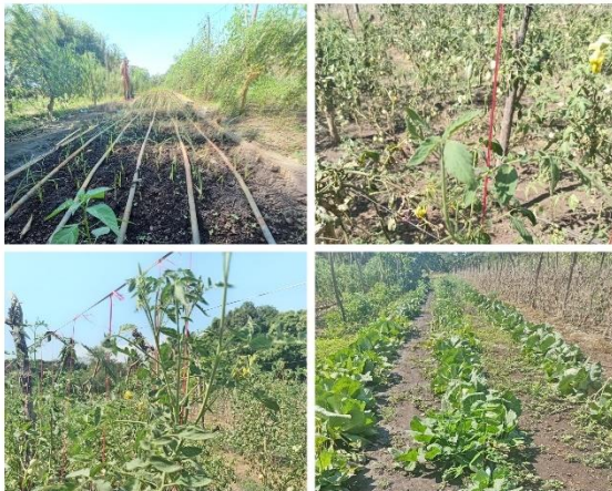
Figura 9. Visitas de seguimiento y monitoreo en el proyecto FIDEAGRO.

Se realizaron visitas de seguimiento y monitoreo a las parcelas de los productores en los distritos de Tamanique, Chiltiupán y La Libertad Costa, para instalar los sistemas de riego por goteo hasta el momento de la producción de dichos proyectos.