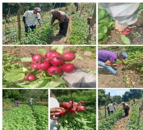
Figura 39. Productor beneficiario del proyecto SIAF en el cantón El Jobo, distrito de Tamanique.

Durante la pasantía de práctica profesional se observaron los problemas más frecuentes que los productores tienen en sus parcelas como: deficiencia nutricional de nitrógeno y fósforo, presencia de malezas, problemas de plagas y enfermedades en los diferentes cultivos de hortalizas.