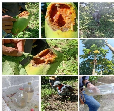
Figura 26. Visita de asistencia técnica a productor de fruta en cantón El Brisolun distrito de La Libertad Costa.

Visita de asistencia técnica a pequeños productores de una asociación de veteranos de guerra donde la mayoría tiene cultivo de granos básicos, plátano y pitahaya. Se observó problemas de plagas y enfermedades, mediante la asistencia técnica se hicieron diferentes recomendaciones para mejorar la producción.