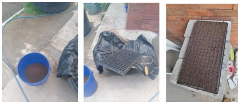
Figura 16. Elaboración de semillero de tomate y chile dulce.

a los productores que participan en las escuelas de campo, para que se motivaran a seguir produciendo.