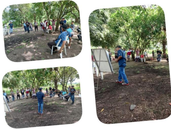
Figura 56. Reunión con productores excombatientes miembros de la AVPA.

Todas las capacitaciones se realizaron de acuerdo a un plan de trabajo proporcionado por el CENTA y basado en el Diagnóstico Rural Participativo realizado en la zona de trabajo.