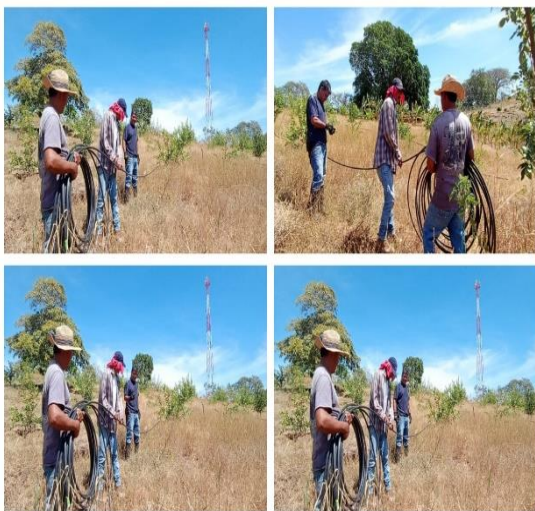
Figura 17. Instalación de un sistema de riego por goteo en árboles de limón pérsico en La Shila, Comasagua.

Se apoyó en la instalación de dos sistemas de riego por goteo, uno en el cultivo de limón pérsico y el otro se estableció en la parcela demostrativa de hortalizas en el cantón La Shila distrito de Comasagua.