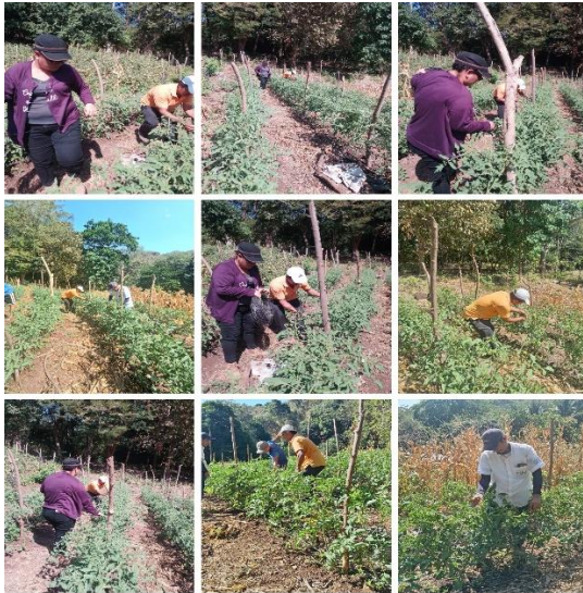
Figura 49. Vista de asistencia técnica a productor comercial de hortalizas.

propósito de optimizar el aprovechamiento de los nutrientes y realizar la práctica de evaluación de los suelos para determinar su calidad para el proceso de restauración.