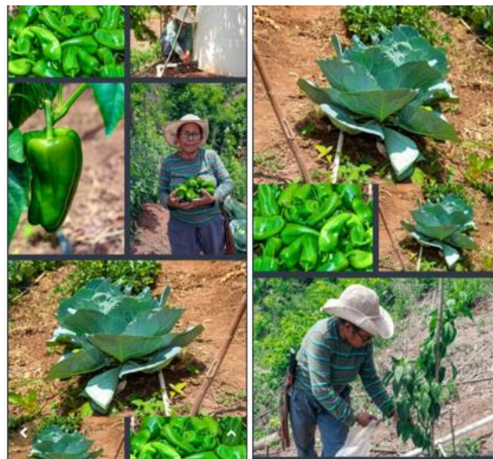
Figura 38. Productor beneficiario del proyecto SIAF en el cantón Santa Lucía, distrito de Chilitupán.

Durante la pasantía de práctica profesional se observaron los problemas más frecuentes que los productores tienen en sus parcelas como: deficiencia nutricional de nitrógeno y fósforo, presencia de malezas, problemas de plagas y enfermedades en los diferentes cultivos de hortalizas.