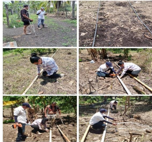
Figura 8. Instalación de sistema de riego por goteo a productora beneficiaria del proyecto FIDEAGRO en distrito de Tamanique.