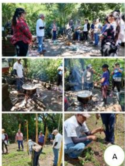
Figura 3. Escuela de Campo en el cantón Amaquilco distrito de Huizúcar.

manejo integrado de plagas y enfermedades, donde se capacitaban hombres, mujeres y jóvenes en los cantones Amaquilco y El Sunzal en el distrito de Huizúcar y Tamanique, como alternativas para mejorar la producción; se estableció en cada cantón una parcela demostrativa con cultivo de pepino, tomates y berenjena.