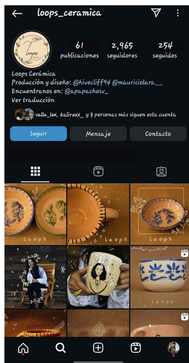
Figura 5: Información inicial

El proyecto también cumplió un papel fundamental en la revalorización de la cerámica salvadoreña, especialmente en su vertiente utilitaria. Se promovió la conexión entre la cerámica, la identidad cultural y las oportunidades económicas, lo que impulsó la demanda de productos artesanales locales y fortaleció el emprendimiento ceramista.