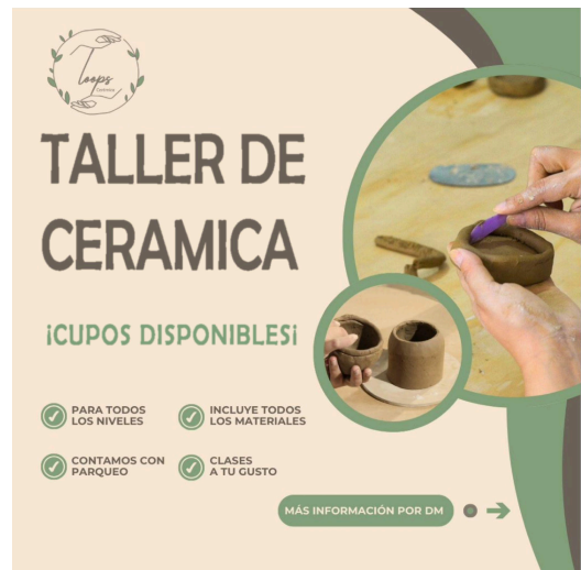
Figura 4: Arte digital

Por medio de las publicaciones se anunciarán fechas y detalles de próximos talleres utilizando diseños atractivos.