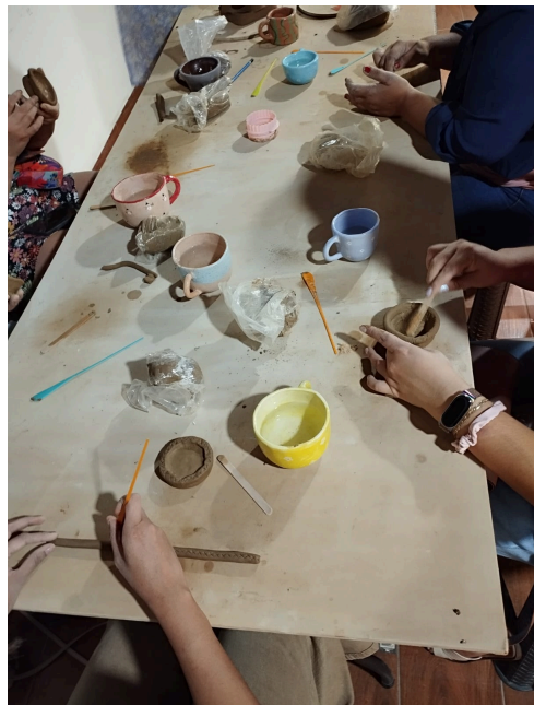
Fotografías tomadas durante los talleres de cerámica impartidos en LOOPS.