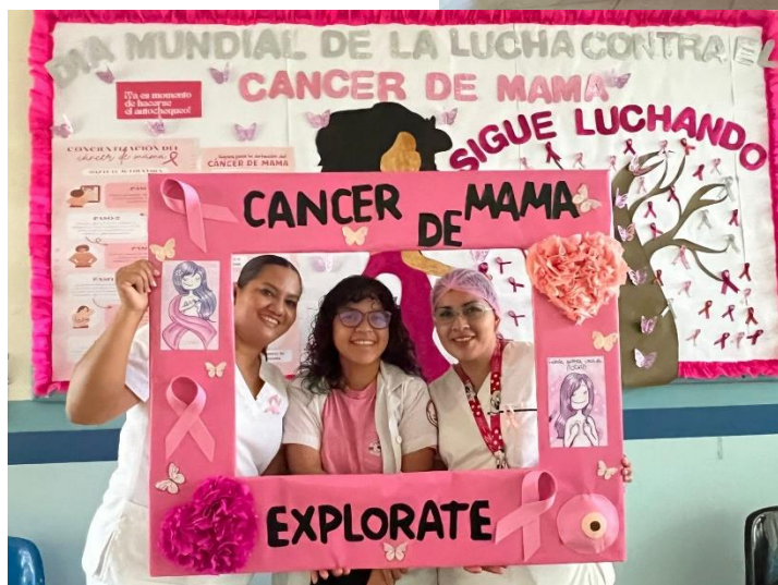
Entrega educativa en el día mundial de la prevención del cáncer de mama