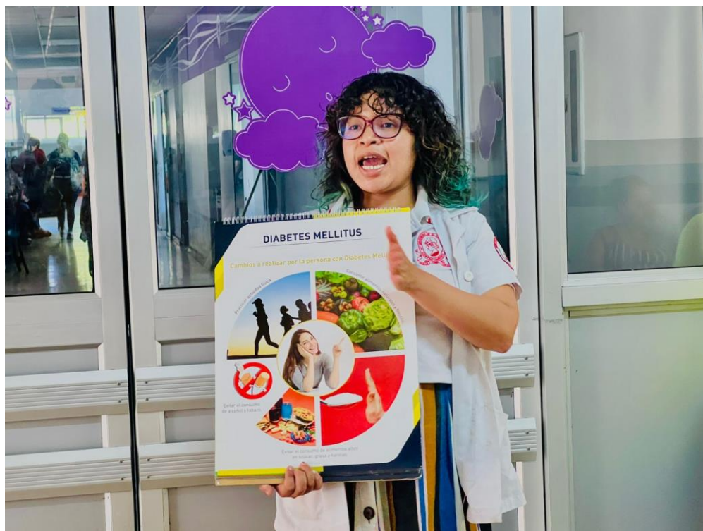
Entregas educativas en sala de espera de Proyecto Ángel a mujeres embarazadas