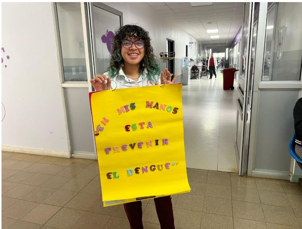
Rotafolio elaborado para las actividades del “Día D” para la prevención de las arbovirosis