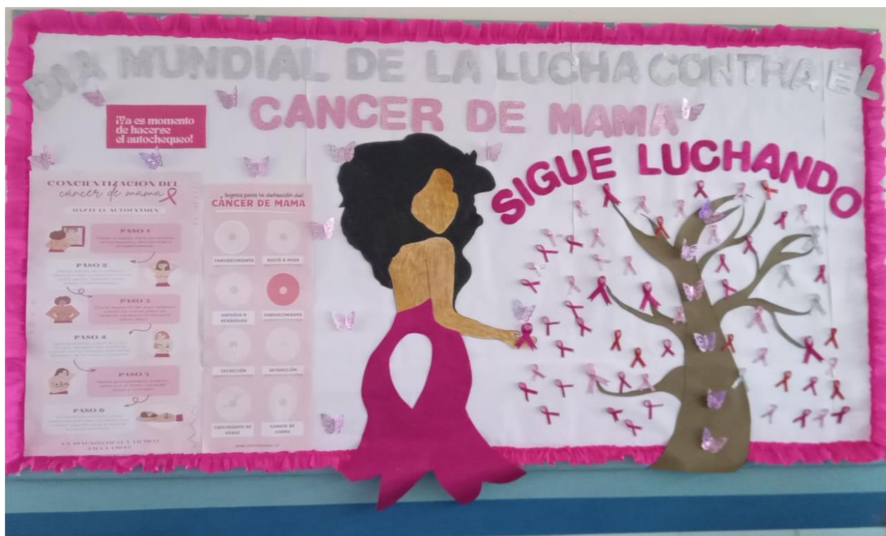
Murales educativos en sala de espera de Consulta General