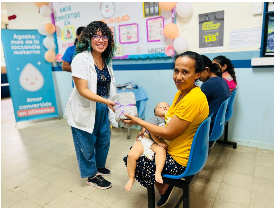
Entrega educativa con grupo de mujeres embarazadas y madres lactantes