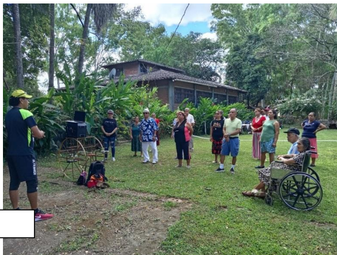
Clases de aeróbicos.