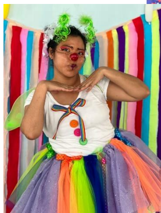
Lulú, personaje que estuvo ese día dando las intervenciones educativas