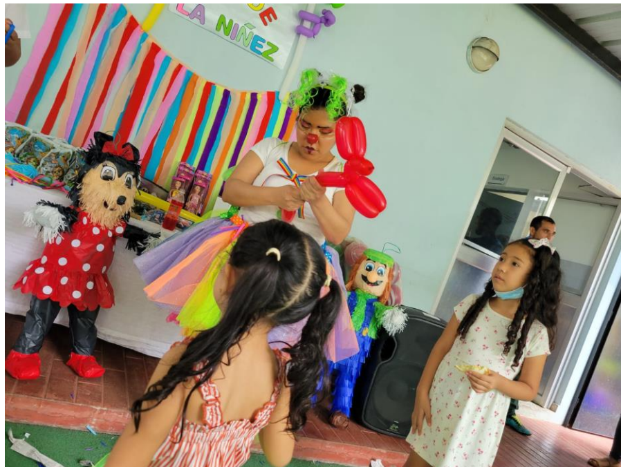
Entrega de regalos, globos y comida.