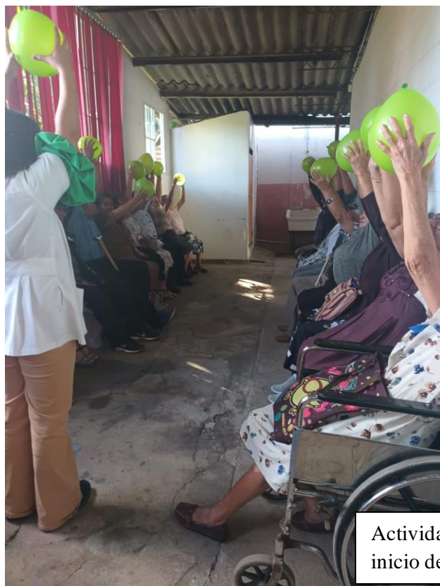
Actividad física al inicio de la sesión