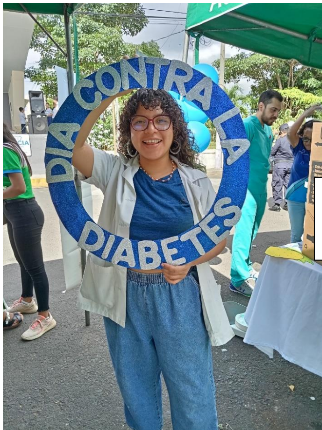
Conmemoración día mundial de la prevención de la diabetes realizada en el parque central de Chalchuapa