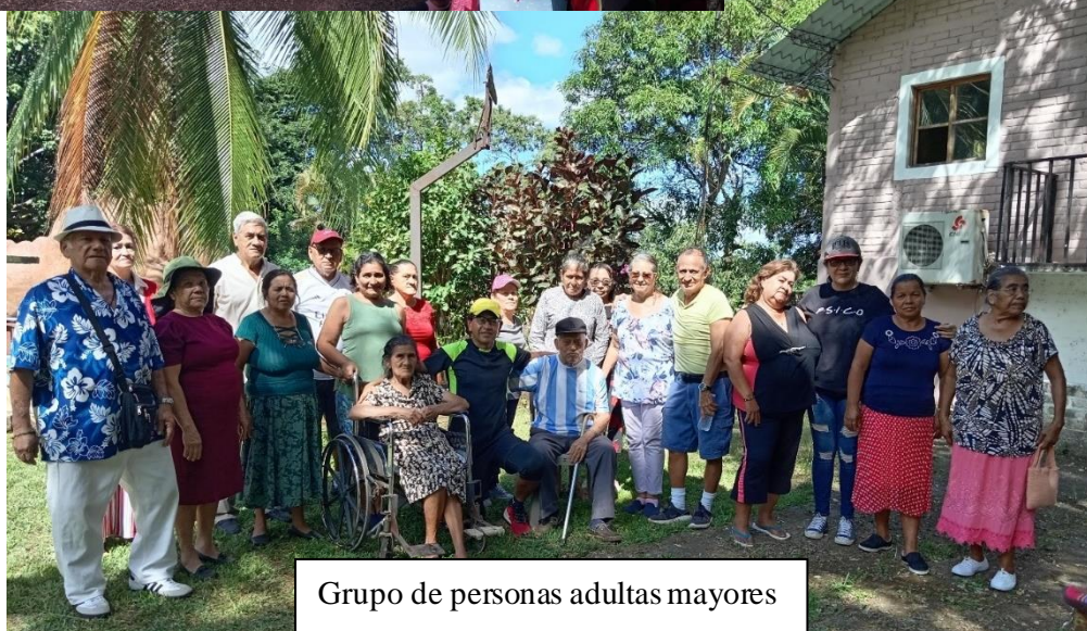
Grupo de personas adultas mayores