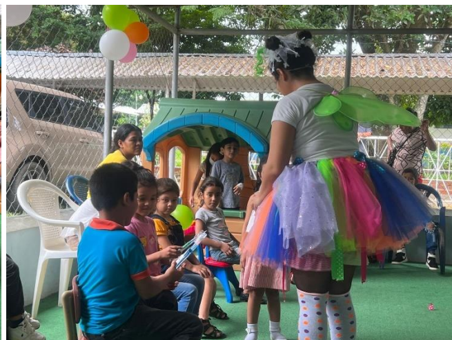
Entrega educativa sobre correcto cepillado de dientes y entrega de cepillos