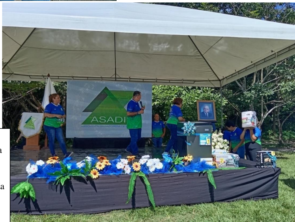
Conmemoración día mundial de la prevención de la diabetes por ASADI, realizada en el Parque Bicentenario