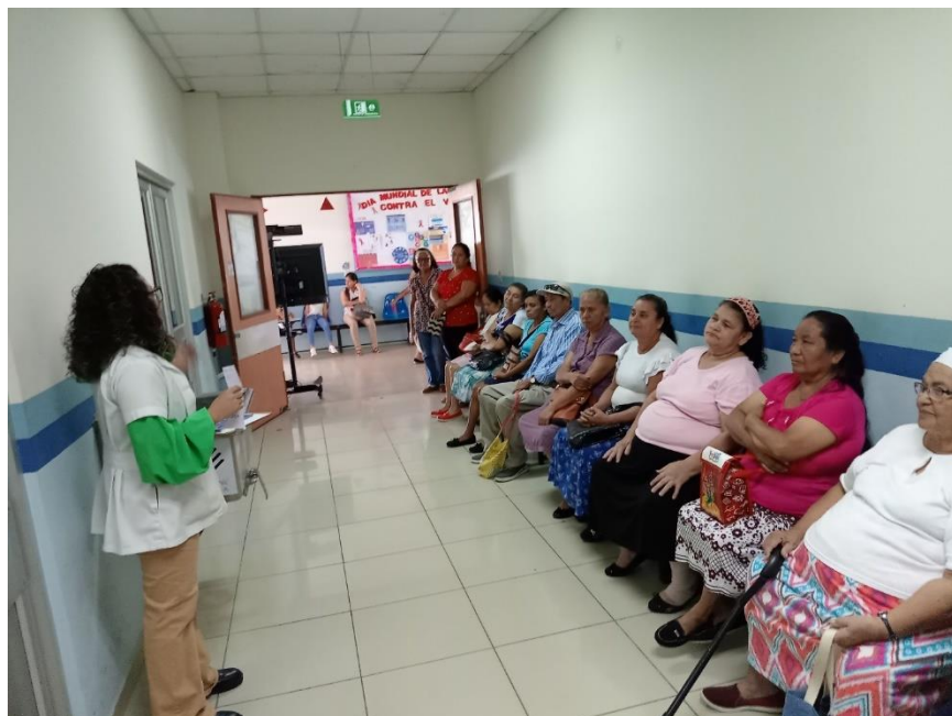
Entregas educativas en el área de Consulta Externa