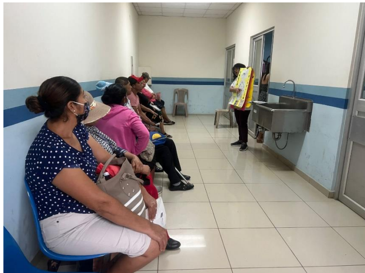
Entregas educativas en el área de Consulta Externa