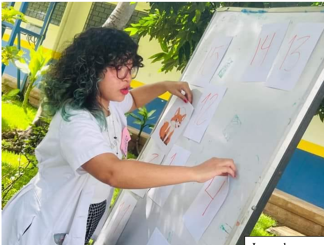
Juego de memoria

Actividades lúdicas durante las sesiones con el grupo de personas adultas mayores.