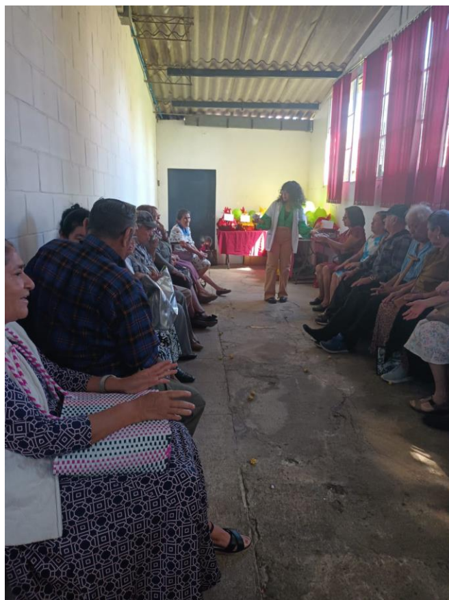
Ultima sesión con el grupo de personas adultas mayores y fiesta navideña.