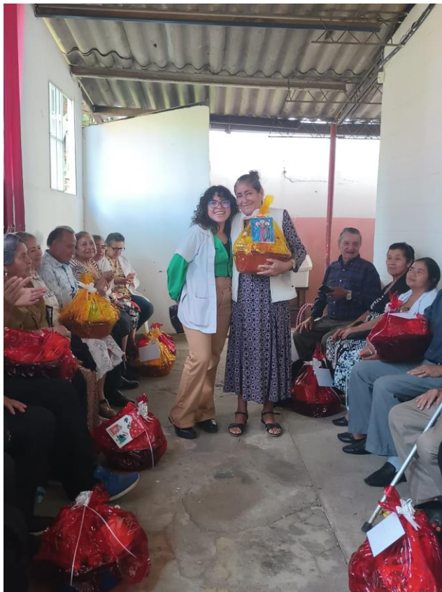
Entrega de canastas navideñas y cierre del año