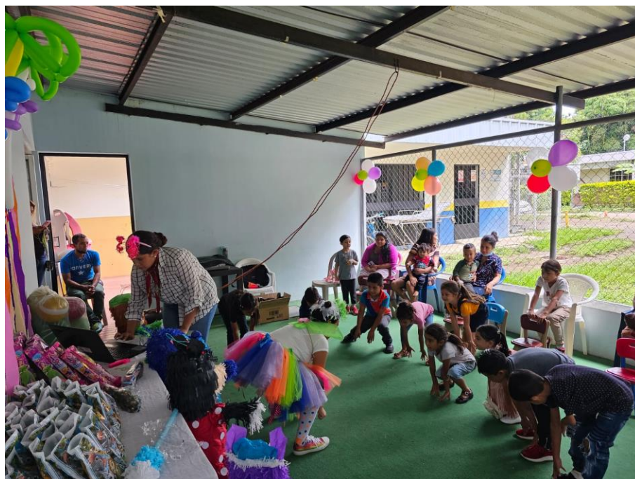
Celebración día de la niñez