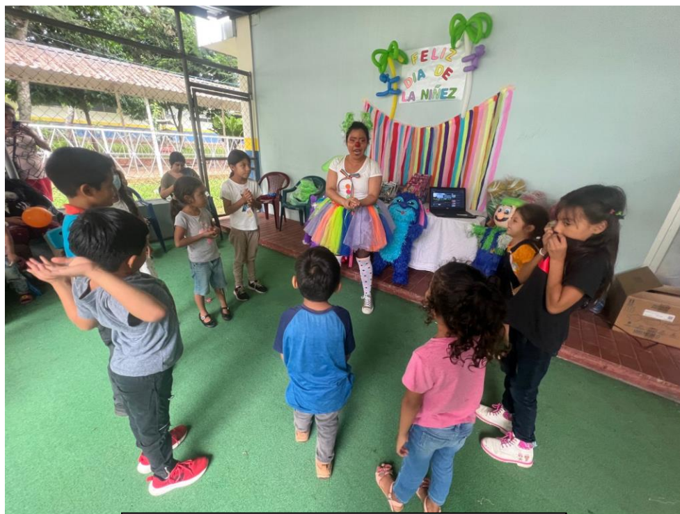
Entrega educativa sobre correcto lavado de manos