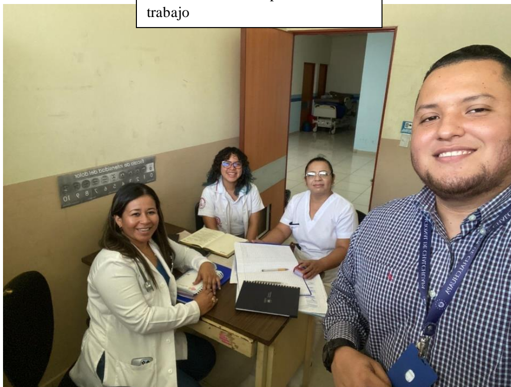
Conmemoración del Día de los Cuidados Paliativos