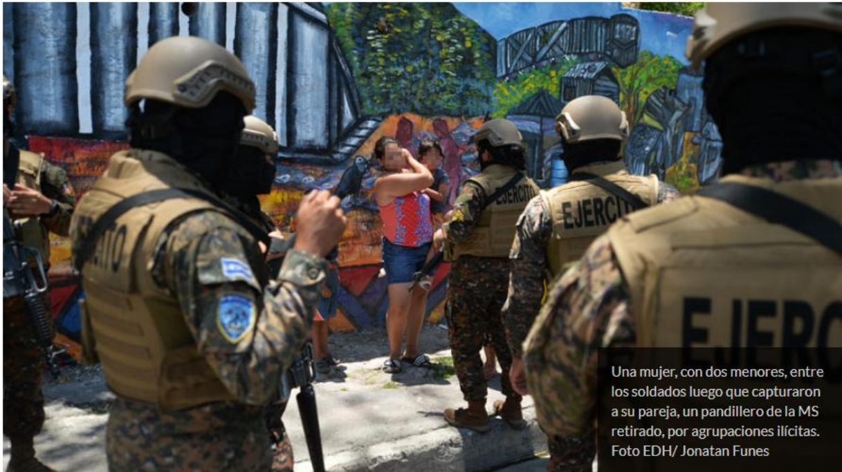
Una mujer, con dos menores, entre los soldados luego que capturaron a su pareja, un pandillero de la MS retirado, por agrupaciones ilícitas.