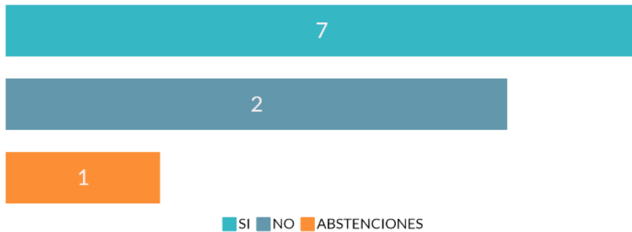
Gráfico 4. Consulta en cuanto si la tecnología buscaba resolver los problemas existentes en temas de democracia y política salvadoreña y con ello generan un aumento en la participación.

Está de acuerdo con la siguiente afirmación: “los procesos de innovación tecnológica busca mejorar lo ya existente, pero no resuelven los problemas políticos y democráticos de una nación. Es decir nuestras democracias necesitan algo más que una capa de pintura”