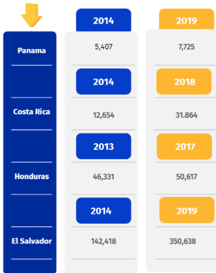
Cuadro 2. Universo de ciudadanos Centroamericanos desde el exterior entre 2013 a 2019.

posicionando su democracia en 6.5% para 2008 (anexo 1, p.187) y en cuanto a participación ciudadana un porcentaje de 68.57% (anexo 2, p.188) para el 2014. Aunque Panamá es un país que tienen un índice democrático intermitente con incremento y decrecimiento entre 2017 y 2019 se mantenido en 7.08 % y 7.05% (anexo 1, p.187).