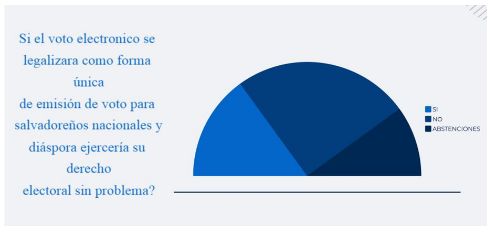
Gráfico 3. Consulta de carácter informativo el interés que causaba el voto electrónico como modalidad legal.

Bajo esta premisa en el cuestionario aplicado a los participantes se buscó por estrategia consultar el interés que generaban voto electrónico y de aplicar la tecnología a las votaciones cuales serían las temáticas que generaban mayor o menos interés (Ver: anexo 5, pregunta 7).