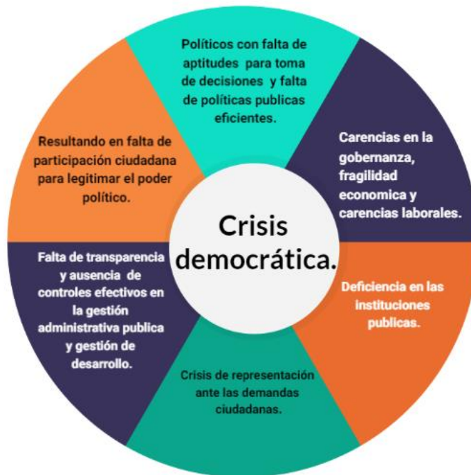
Gráfica 1. Grietas que contribuyen a la erosión y fracturación democrática

Fuente: elaboración propia con datos de los análisis del Real Instituto Elcano e Instituto Internacional para la democracia y la Asistencia Electoral entre 2019-2021.