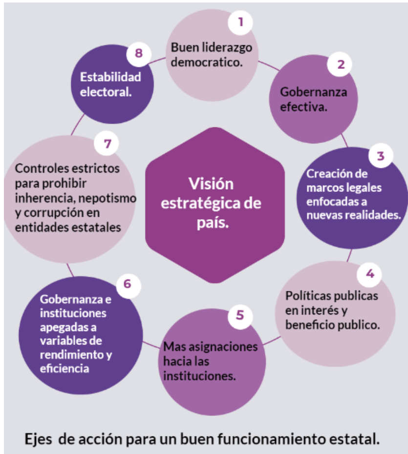
Gráfica 6. Ejes estratégicos para el desarrollo y fortaleciendo democrático. Fuente: elaboración propia de factores que se identifican importantes para mejorar la visión y objetivos de país.