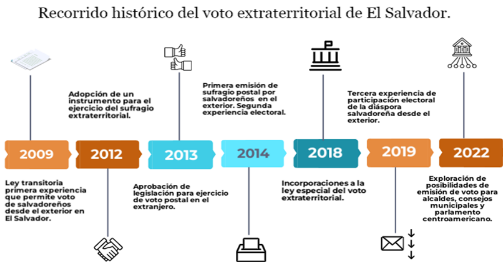
Gráfica 2. Línea de tiempo sufragio de salvadoreños en el exterior 2009-2022

La ley no presenta divisiones por capítulos o subtemas que especifique la normativa bajo un lineamiento específico. Sin embargo, cada artículo expresa los procedimientos a seguir, fundamentos y desarrollo del proceso electoral bajo la supervisión del Tribunal Supremo Electoral.