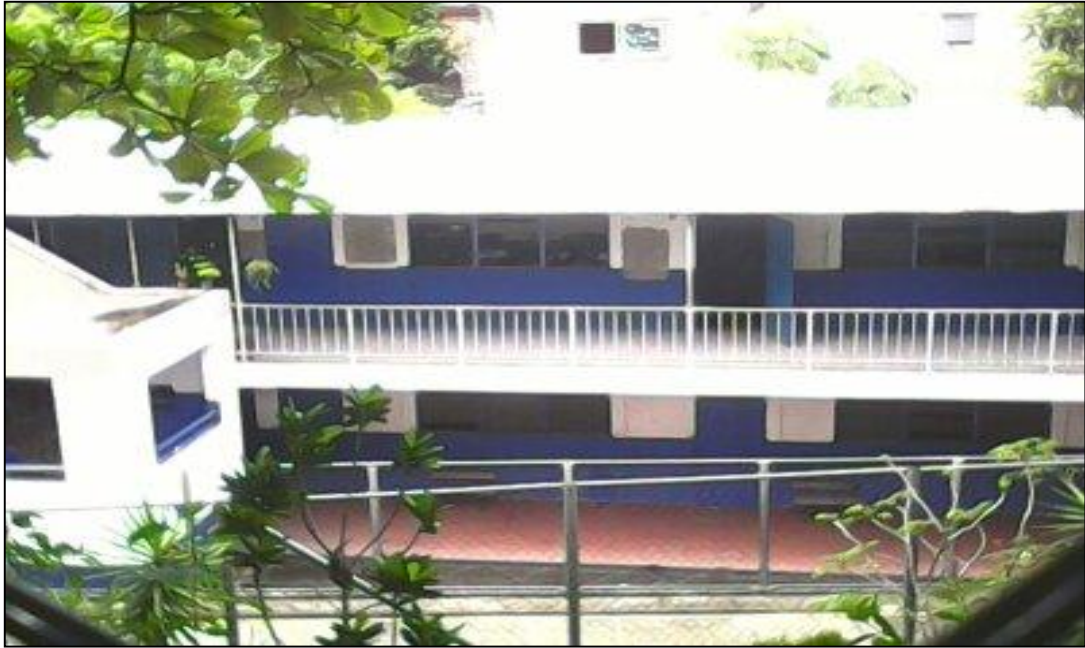
Fuente: fotografía tomada por estudiantes egresados de la Licenciatura en Trabajo social, Instalaciones del Centro Escolar San Antonio Abad el 9 de junio de 2015.