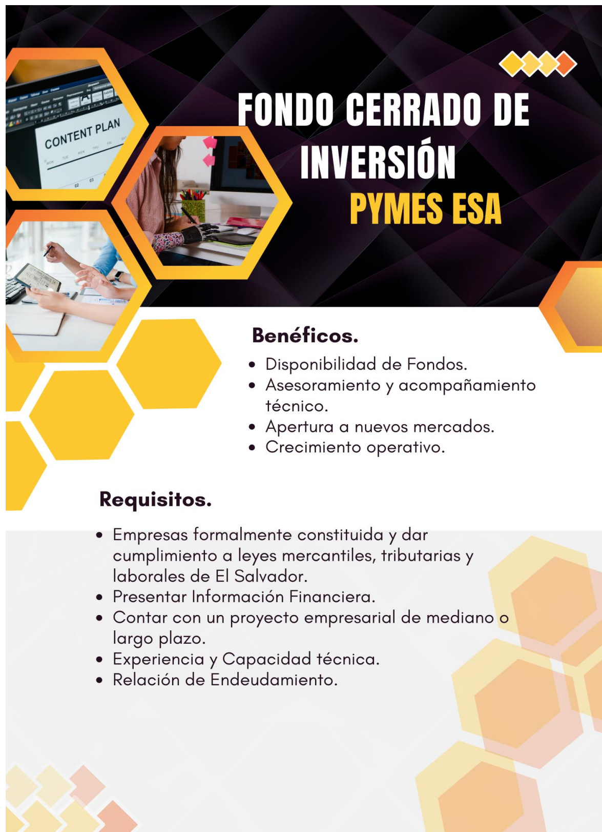
Imagen 2. Propuesta de publicidad para el Fondo Cerrado de Inversión PYMES ESA.