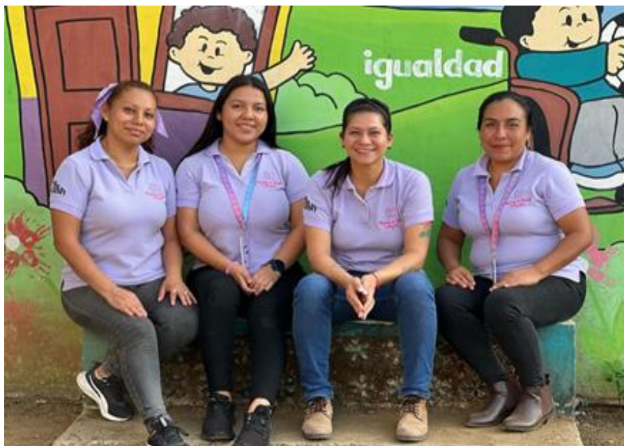
1 Foto/Miembros del colectivo Mujeres de Xóchilt.

Son cuatro jóvenes las que actualmente integran el colectivo Mujeres de Xóchilt, quienes, además, buscan llevar a cada rincón de Nahuizalco el empoderamiento de niñas y mujeres, creando espacios para hablar de los derechos y la salud de las niñas, adolescentes y mujeres.