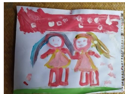
Figura 15. Pintura elaborada por niña de seis años durante la sesión cinco del taller. 27 de junio, 2024.