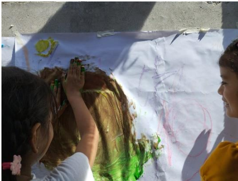
Figura 10. Niñas pintando sobre pliegos de papel bond durante la sesión dos del taller. 14 de junio, 2024.