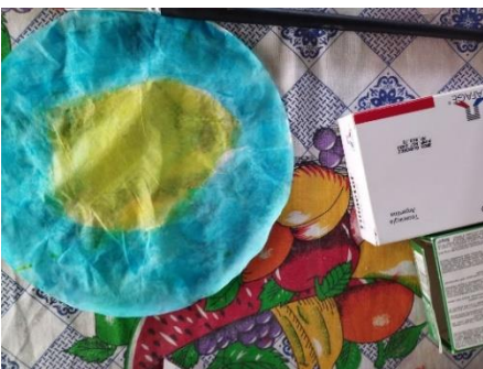
Figura 20. Pintura elaborada sobre papel filtro por niño de nueve años durante la sesión seis del taller. 28 de junio, 2024.