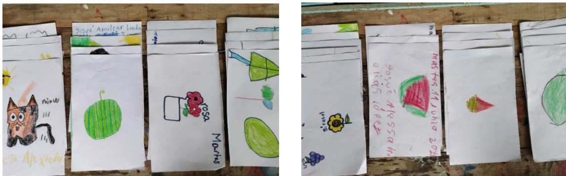
figura 2 y 3. Ejemplos de dibujos elaborados durante la primera sesión del taller bajo la actividad ¿si fueras...?