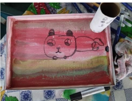
Figura 23. Pintura elaborada sobre cartón por niño de ocho años durante la sesión seis del taller. 28 de junio, 2024.