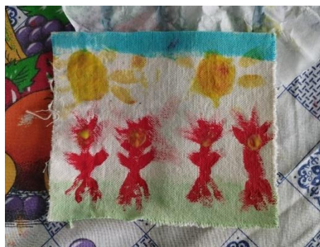
Figura 21. Pintura elaborada sobre tela por niña de ocho años durante la sesión seis del taller. 28 de junio, 2024.