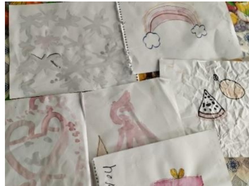
Figura 9. Pinturas realizadas con tintes naturales durante la sesión tres del taller. 25 de junio, 2024.