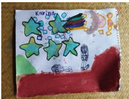
Figura 16. Pintura elaborada por niña de ocho años durante la sesión cinco del taller. 27 de junio, 2024.