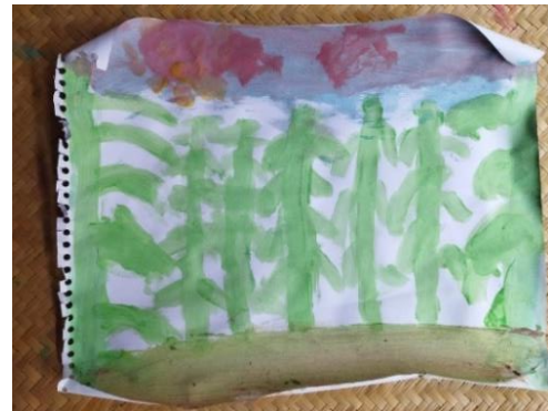
Figura 14. Pintura elaborada por un niño de ocho años durante la sesión cinco del taller. 27 de junio, 2024.