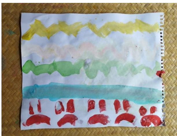
Figura 5. Ejemplo de pintura realizada por un niño de ocho años durante la sesión cinco del taller.

Posteriormente en grupo y con ayuda de la facilitadora, prepararon los materiales y seleccionaron el suelo como espacio de trabajo para la actividad. Nuevamente se brindaron las indicaciones para la actividad, se preparó el dispositivo para compartir las melodías de canciones con los participantes mientras ellos se tomaban el tiempo de escuchar, sentir, interpretar y graficar mediante la pintura generando líneas y manchas acorde a las emociones que les fueron transmitidas por la música. Se reprodujeron cinco canciones para la actividad con melodías de ritmo alegre, triste, enojo, feliz y calma. Al finalizar los participantes seleccionaron una canción de su interés para escuchar durante el orden y limpieza de los materiales. Además, los participantes dialogaron sobre sus intereses musicales, lo que les hace sentir la música y como gestionan cada una de las emociones expuestas en la actividad.