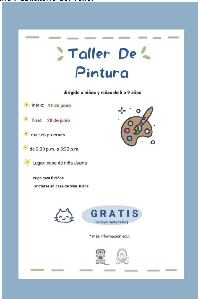
Figura 29. Diseño de afiche y tarjetas de invitación al taller.