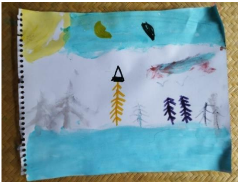
Figura 13. Pintura elaborada por un niño de ocho años durante la sesión cinco del taller. 27 de junio, 2024.