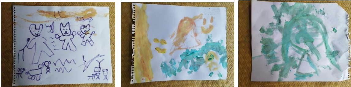
Figuras 17, 18 y 19. Ejemplos de pinturas elaboradas por niñas y niños de seis y ocho años respectivamente durante la sesión cinco del taller bajo el tema: Música y Emociones A través de la Pintura. 27 de junio, 2024.