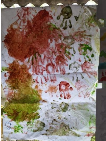
Figura 7. Pliego de papel bond pintado como resultado de la sesión dos del taller.