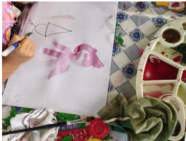
Figura 4. Participante de seis años pintando con tintes naturales en la segunda sesión del taller.

Se prepararon los materiales indicando el uso de cada material. Se guió a los participantes en la preparación de los pigmentos acorde a su selección, rosas, buganvilia, rocas y margaritas amarillas silvestres. Además, se tenía previamente preparado como muestra agua de infusión de insulina y jugo de remolacha. Al finalizar la preparación de los pigmentos se procedió a las pruebas de color, donde los participantes experimentaron con jugo de limón como modificador de color. Con los resultados obtenidos, los participantes crearon sus propias obras a partir de sus intereses dando un acabado a sus pinturas utilizando plumones.