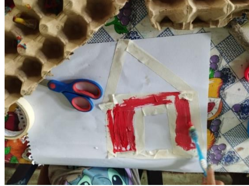
Figura 11. Niña de seis años experimentando con textura de cepillo durante la sesión cuatro del taller. 26 de junio, 2024.