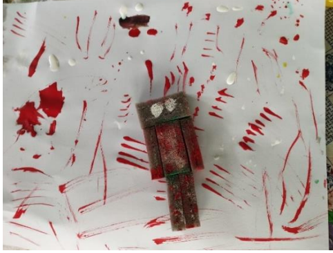
Figura 12. Ejemplo de prueba de textura y figura hecha con esponjas por un niño de nueve años durante la sesión cuatro del taller. 26 de junio, 2024.