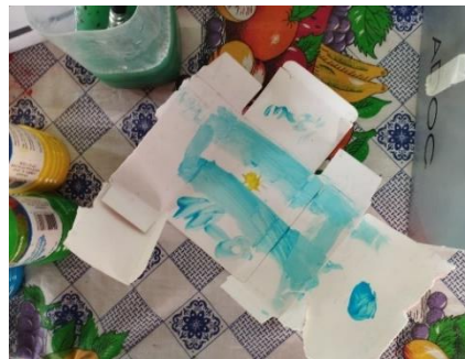
Figura 22. Pintura elaborada sobre cartón por niño de nueve años durante la sesión seis del taller. 28 de junio, 2024.