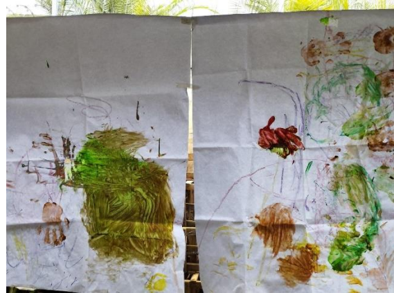
Figura 8. Pliegos de papel bond pintados como resultado de la sesión dos del taller.