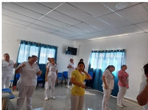
Acompañamiento a grupos de auto - cuidado