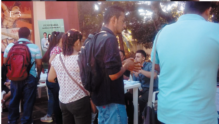
▲ F. 1, F. 2, F. 3. Feria de empleo en la Facultad Multidisciplinaria de Occidente, se ofrecieron 189 plazas correspondientes a 13 empresas.

Durante todo el año la bolsa de trabajo de la Unidad de Proyección Social de la Facultad Multidisciplinaria de Occidente, desarrolló muchas actividades encaminadas a orientar, preparar y acercar a los graduados, egresados y estudiantes del occidente del país las herramientas necesarias para incorporarse al mercado laboral.