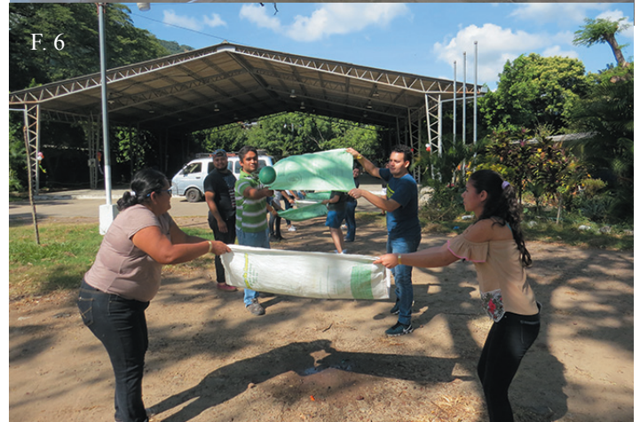
⤴ F. 5, F. 6. Convivio educativo de la licenciatura en idioma inglés, en la actividad hubo karaoke, carreras con saco, juegos con globos y actividades de campo.