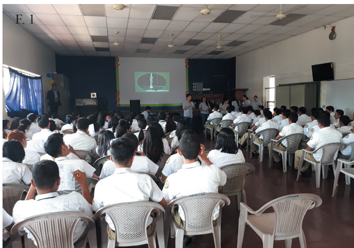
F. 1. El proyecto de cátedra tuvo como objetivo concientizar sobre la importancia de los bioelementos y como incluirlos en la dieta diaria.

El proyecto dio inicio formando tres grupos de 35 estudiantes para realizar en primera fase una investigación documental, para llevarla a cabo se realizó una investigación bibliográfica donde se recolectó toda la información necesaria relacionada al tema de bioinorganica. Luego se implementó