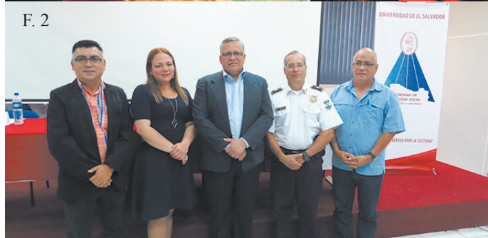
^ F. 1, F. 2. En esta jornada se planteó un acercamiento de experiencias entre la institución policial y la Universidad de El Salvador en el desenvolvimiento de la proyección social.