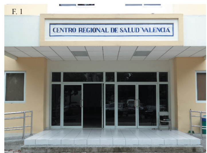
▲ F.1 Instalaciones del Centro Regional de Salud Valencia.