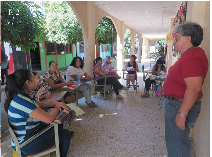
▲ F. 1. F. 2. Desarrollo de la Escuela Comunitaria en las instalaciones de la Facultad Multidisciplinaria Paracentral

su niño y eso lo motiva más, lo cual lo hemos podido comprobar acá". La cantidad aproximada de asistencia está de 20 niños por especialidad.