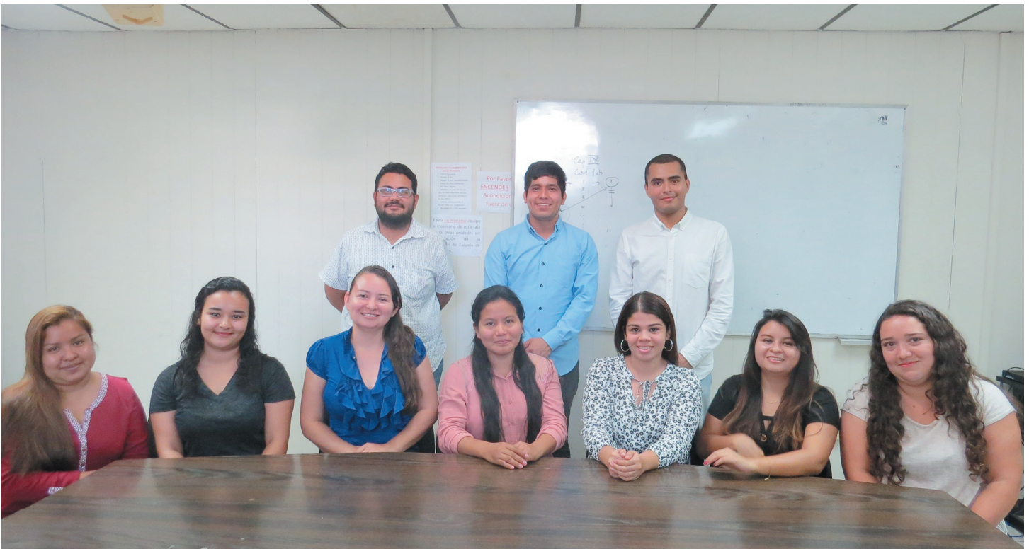
▲ F. 1. Estudiantes de la Facultad de Ciencias Económicas, elaboraron carpetas técnicas de proyectos sobre programas de desarrollo comunitario en Verapaz municipio de San Vicente.

ante autoridades municipales e instituciones sin fines de lucro para que exista un posible financiamiento para los diferentes proyectos. Las expectativas que las personas de Verapaz tienen con el desarrollo de las carpetas técnicas es indudablemente en beneficio para mejoras de la comunidad, condiciones de infraestructura, facilidad en el traslado de personas, mejora de condiciones de comercio del sector y beneficios en educación.