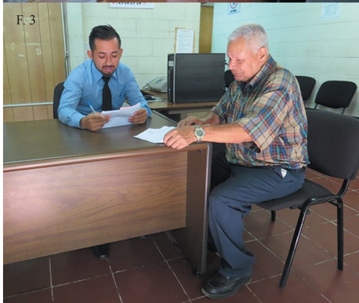
⤴ F. 2, F. 3. En el centro de prácticas se brinda atención a la población salvadoreña sin ningún costo.

que pueden contar para la ejecución de proyectos dirigidos a la población de bajos recursos económicos.