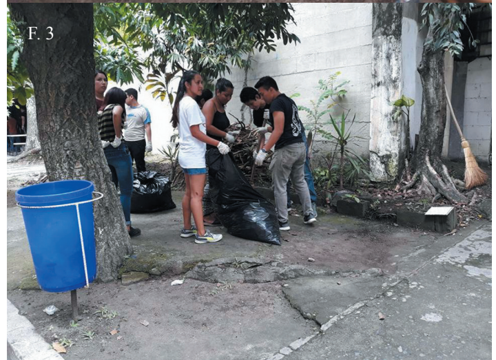
▲ F. 2, F. 3. Campaña de limpieza en la Facultad de Ciencias Económicas por estudiantes de la coalición.