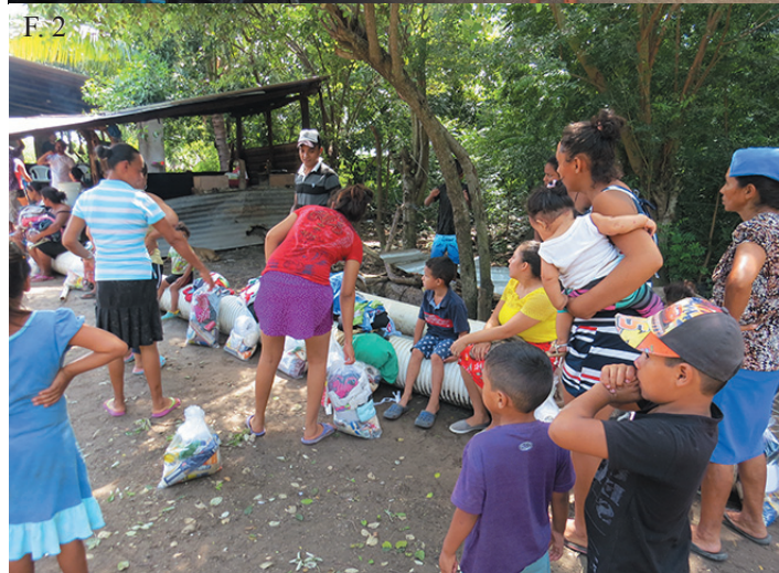
▲ F. 1, F. 2. La Secretaría de Proyección Social, realizó la entrega de ropa y paquetes de víveres a las personas afectadas de Puerto Parada del Departamento de Usulután.