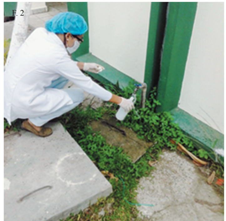
⤴ F. 2. Toma de muestras de agua de distintas partes del campus universitario para ser analizadas en el laboratorio.

Un monitoreo periódico de la calidad del agua potable es lo que se pretende hacer en el campus central de la UES, permitiendo establecer los factores de riesgo ambientales para la salud, que puede presentar el recurso suministrado por ANDA, además facilita el desarrollo oportuno de criterios encausados a la prevención o corrección de las no conformidades que se evidencien en dicho monitoreo.