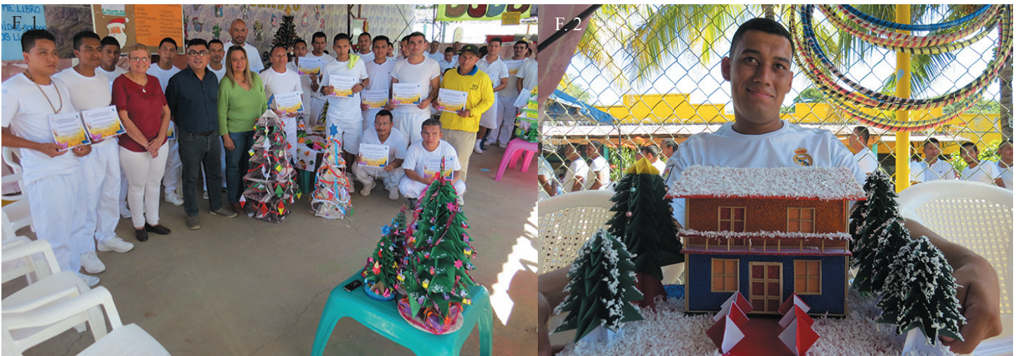
F. 1, F. 2. Clausura del curso de origami navideño en el Centro Penal de Apanteos.

Para el año 2019, la Secretaría de Proyección Social con el apoyo de varias facultades planea seguir ejecutando más proyectos enfocados en beneficiar las habilidades y conocimiento de los internos de este centro penal.