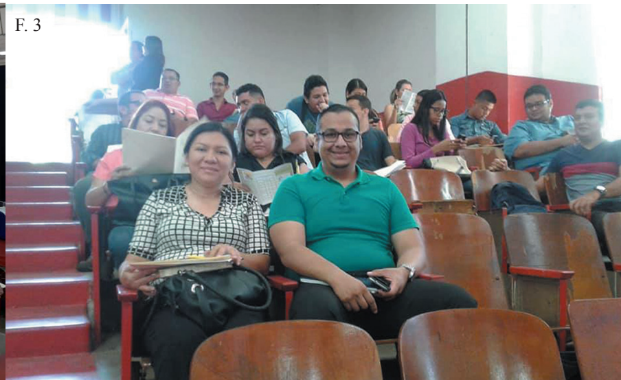
⤴ F. 2. F. 3. Participantes del curso básico “La importancia de las dimensiones del desarrollo territorial y los principales desafíos de municipios sostenibles”. en la Facultad Multidisciplinaria de Occidente.