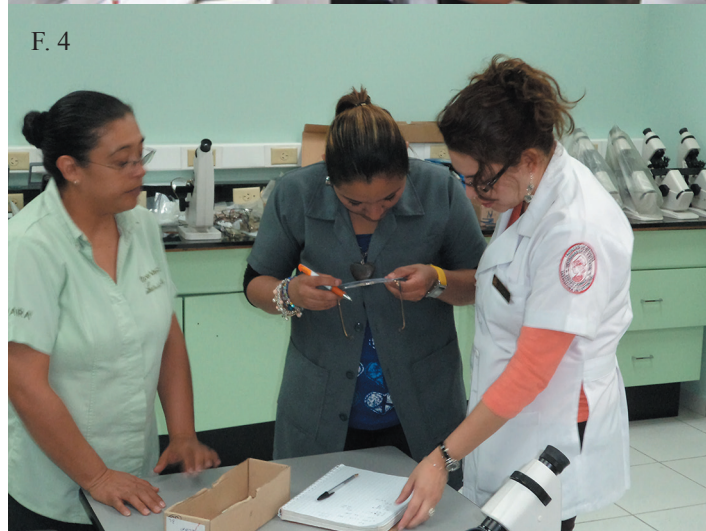
^ F. 2, F. 3, F. 4. El Centro Regional de Salud Valencia tiene el objetivo de brindar servicios de atención visual y auditiva a la población, sector infantil y comunidad universitaria.