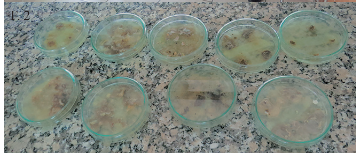
⤴ F. 1, Grupo de estudiantes que participan en el proyecto de “Asistencia en el área de microbiología a través de análisis de los productores en la reserva de biosfera de Apaneca Ilimatepec” F.2. Muestra de bacterias de abono.

presentes en ellos, en aplicar su adiestramiento en el área de la microbiología, para trabajar al servicio de una comunidad que necesita conocer