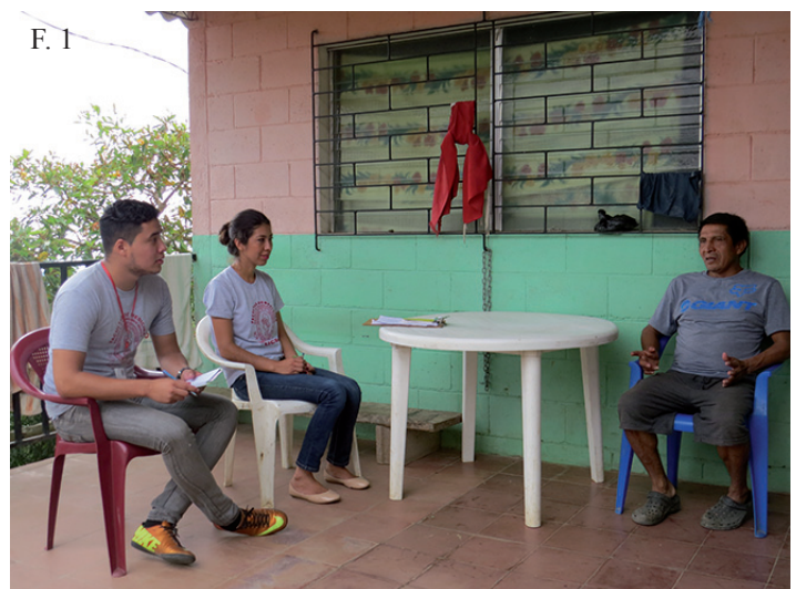
^ F. 1. Estudiantes realizan visita domiciliar la cual tiene como objetivo la obtención de datos de las enfermedades transmisibles como son: respiratorias agudas y febriles más comunes de este territorio. Estos son proporcionados a las entidades respectivas de la comunidad, como las unidades de salud y alcaldías.