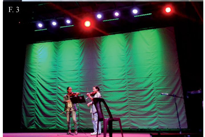
▲ F. 1, F. 2, F. 3. La Facultad de Ciencias Naturales y Matemática fortaleció el arte y la cultura de estudiantes, administrativos y docentes en el teatro universitario.