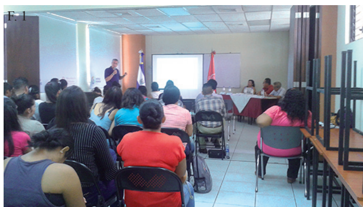
▲ F. 1, En la Facultad Multidisciplinaria Paracentral la Unidad de Proyección Social, realizó el acto de conmemoración del 175 aniversario de fundación de la Universidad de El Salvador.