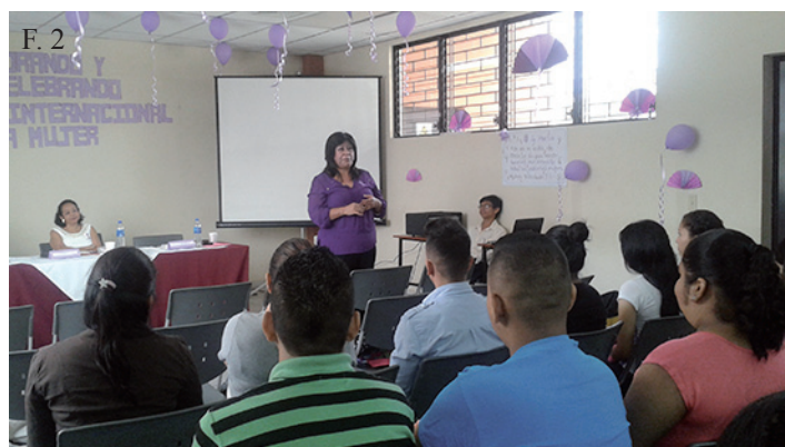
▲ F. 2, En conjunto con la cátedra de seminario de violencia intrafamiliar y de género se realizó un conversatorio conmemorando el Día Internacional de la Mujer en el cual se abordaron diferentes temáticas en las que incursiona la mujer actual.

Entre las actividades ejecutadas, la unidad organizó un acto por la conmemoración de los ciento setenta y cinco años de fundación de la Universidad de El Salvador. En el evento se desarrolló un foro sobre la identidad universitaria, hubo participaciones artísticas y se contó con la presencia de las autoridades centrales y de la facultad. Además en el