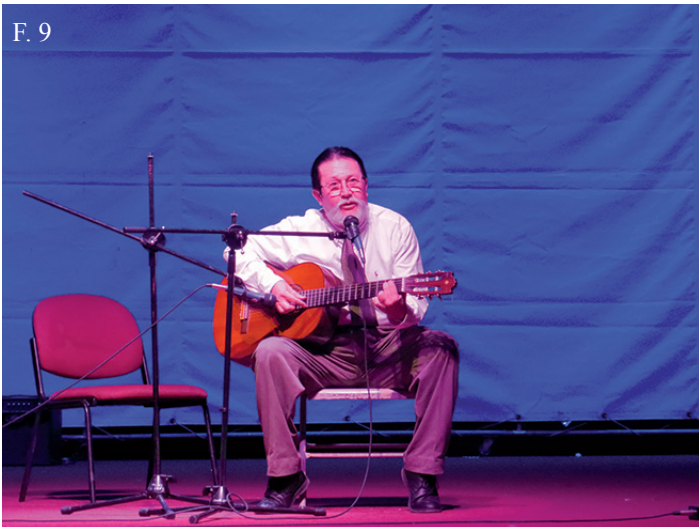
^ F. 7, F. 8, F. 9. Presentaciones artísticas de la Facultad de Medicina.