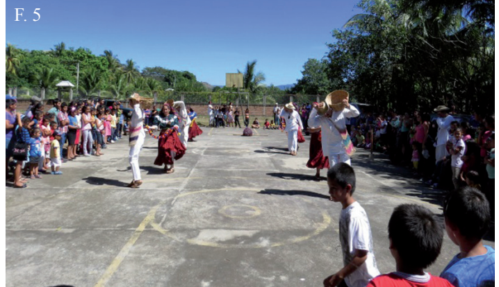
▲ F. 4. Los niños se divirtieron con la quiebra de piñatas. F. 5. Presentaciones artísticas por parte del elenco de la Secretaría de Arte y Cultura fueron parte de la actividad.