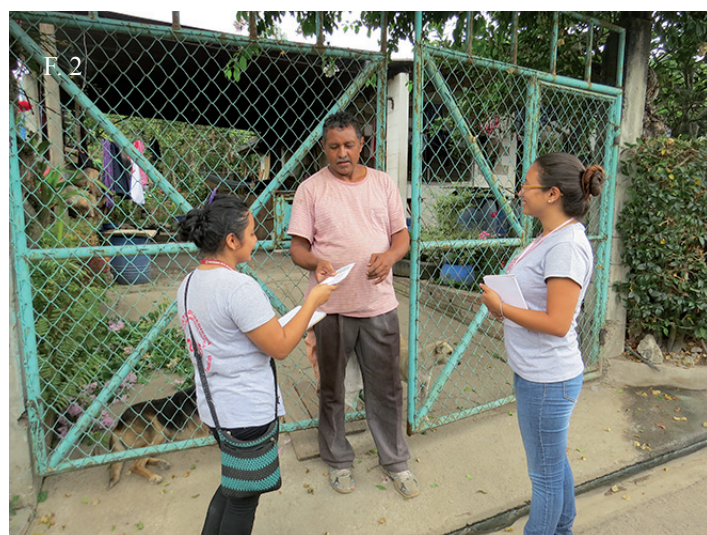
▲ F. 2. Un residente de Nuevo Cuscatlán recibe información sobre salud, proporcionada por estudiante de la Unidad de Ciencias Básicas de la Facultad de Medicina.