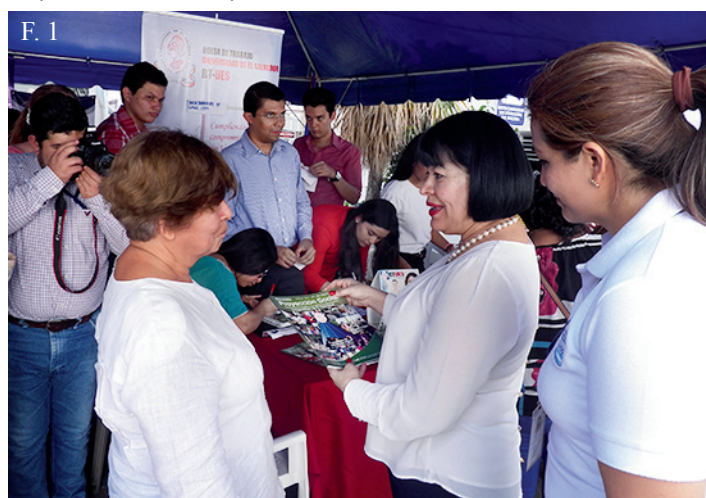
F. 1. La Bolsa de Trabajo de la UES, participó en la feria de empleo para mujeres. La ministra de trabajo visitó el stand de la BTUES.

En el stand de la Bolsa de Trabajo de la Universidad de El Salvador se proporcionó por medio de broshurs el quehacer de la unidad y los contactos para poder incluirse a la base de datos para aspirar a un empleo.