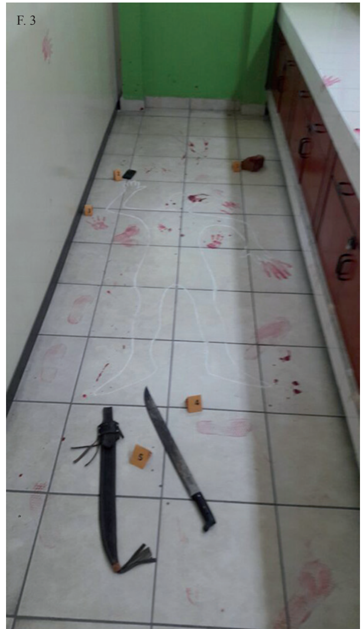
F. 1, F. 2, F. 3. En la semana del químico farmacéutico se desarrolló el día de logros donde se presentó el proyecto “Reactivación de huellas dactilares en sangre mediante técnicas emergentes”, por 26 estudiantes de la cátedra de química forense y toxicología.