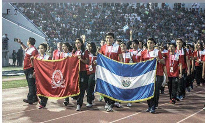
F. 1. F. 2. Diferentes disciplinas deportivas de la Universidad de El Salvador se hicieron presentes en los VI Juegos Deportivos Universitarios Centroamericanos 2016 realizados en la Universidad Nacional Autónoma de Honduras.