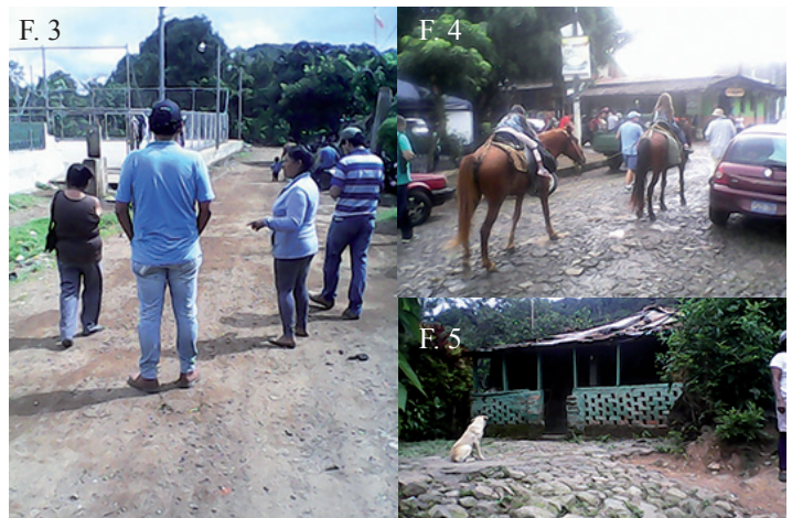
⤴ F.3, F4, F5. Los estudiantes de la carrera de sociología desarrollaron un proyecto para mejorar la economía de las mujeres en Concepción de Ataco con la producción y venta de chocolate a los turistas que visitan el lugar.

Según su planteamiento la situación de pobreza de los sujetos en estudio son: la falta de empleo y/o inexistencia de actividades económicas propias destinadas a generar una fuente de ingresos económicos estable. También elaboraron un árbol de objetivos que determina una propuesta para cada dificultad, entre estas, la existencia de actividades económicas tendientes a generar recursos económicos relativamente estables y periódicos.