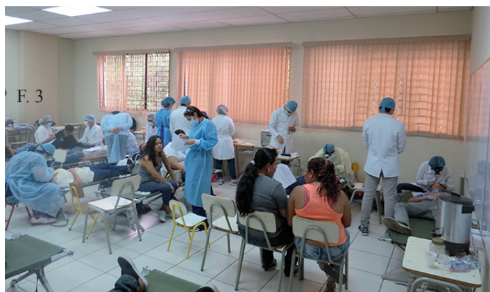
F. 3, En la jornada de salud bucal fueron atendidas más de cincuenta personas entre estudiantes y empleados de la Facultad de Ciencias Naturales y Matemática, a los beneficiarios se les realizaron diferentes procedimientos dentales.