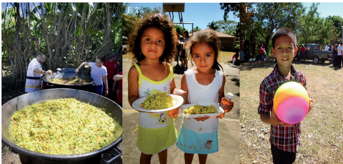
◀ F. 1. F. 2. F. 3. Los habitantes de Santa Isabel Ishutan pasaron un momento de diversión con la entrega de juguetes y la degustación de dos paellas gigantes.

También estudiantes, docentes y administrativos se abocaron y donaron juguetes y piñatas para los niños donde se realizaría el convivio.