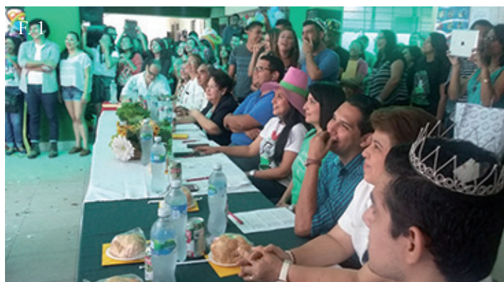
F. 1. Todos los años los estudiantes de la AGEQFBO celebran la semana del estudiante de química y farmacia, realizando diversas actividades como: artísticas, deportivas, culturales y conferencias encaminadas a abonar al conocimiento de los estudiantes.

Los estudiantes, utilizan dichas actividades extracurriculares como único medio de recreación en el año. También, siempre responden con profesionalismo y solidaridad, cuando se necesita apoyo ante desastres naturales a través de la producción de antifúngicos en solución o talco, justo para ser dispensados con la respectiva atención farmacéutica.