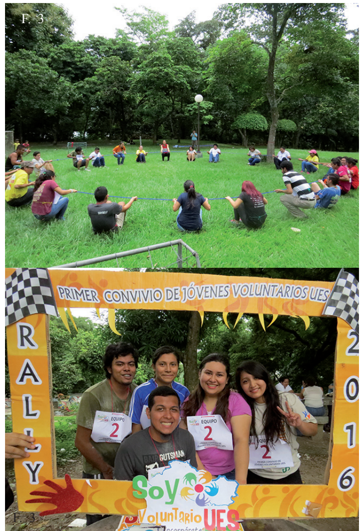
▲ F. 3, 4. El sábado 9 de julio de 2016 se llevó a cabo el primer convivio de jóvenes voluntarios de la Universidad de El Salvador, donde se reunieron voluntarios de diferentes generaciones para promover la convivencia y la filosofía del voluntariado.

aprender e involucrarse en la filosofía del voluntariado.