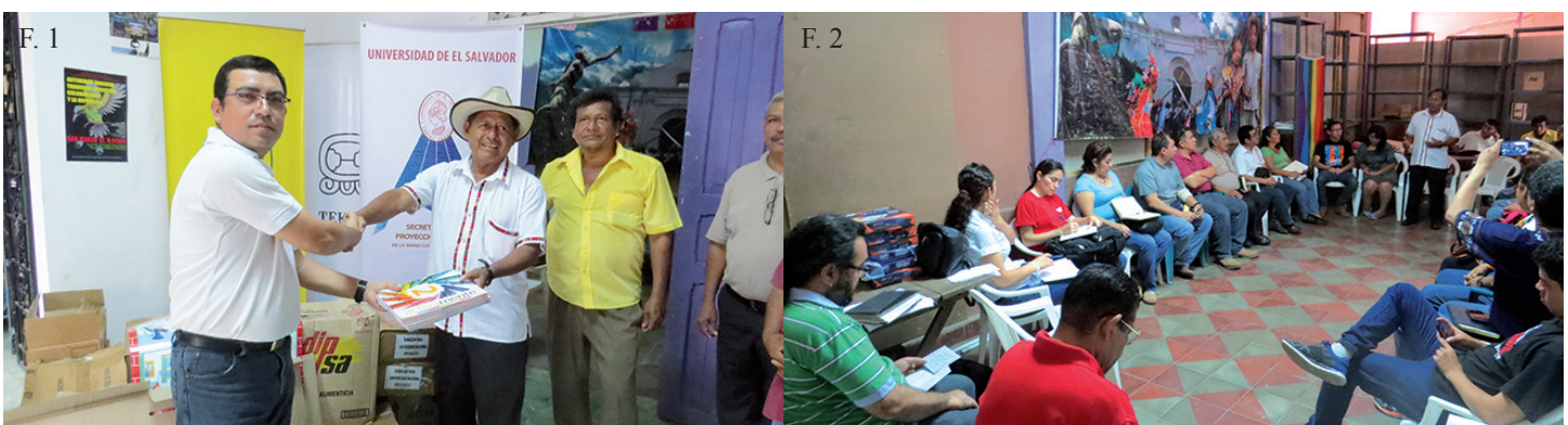
⤴ F. 2, F. 2. La Secretaría de Proyección Social hizo la entrega de una dotación de libros nuevos y usados para la biblioteca de la Alcaldía del Común de Izalco, también se mantuvo una reunión para conocer las necesidades de la comunidad indígena e incidir en ella desde las diferentes áreas del conocimiento que tiene la Universidad de El Salvador.

Con la convicción que la comunidad universitaria continúe apoyando, así como más casas editoriales, la campaña de donación de libros se mantiene permanente, las instalaciones de la Secretaría de Proyección Social se mantienen abiertas esperando la donación de todos, pueden ser libros nuevos o usados en buen estado. Todos los temas y especialidades son útiles para llevar ese conocimiento a los sectores más necesitados.