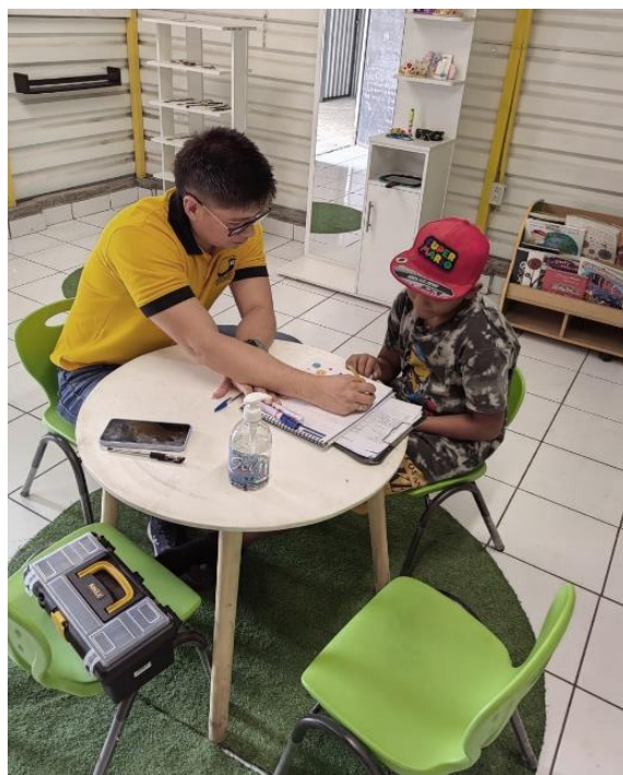
Salón de atención del programa de Ángeles Descalzos, terminal de buses de occidente