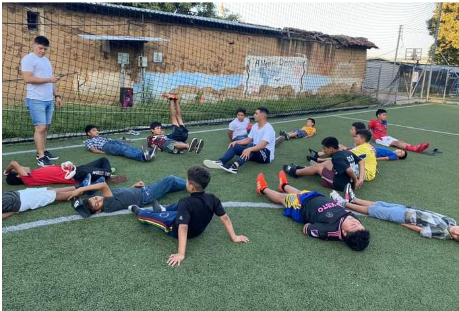
Instalaciones del programa de Ángeles Descalzos, terminal de buses de occidente

Desarrollo de jornada de auto cuidado con niños y pre adolescente