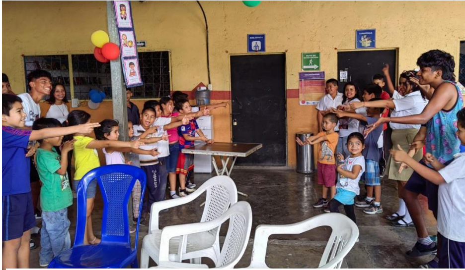
Instalaciones del programa de Ángeles Descalzos, terminal de buses de occidente

Actividad de convivencia de niñas, niños y adolescentes