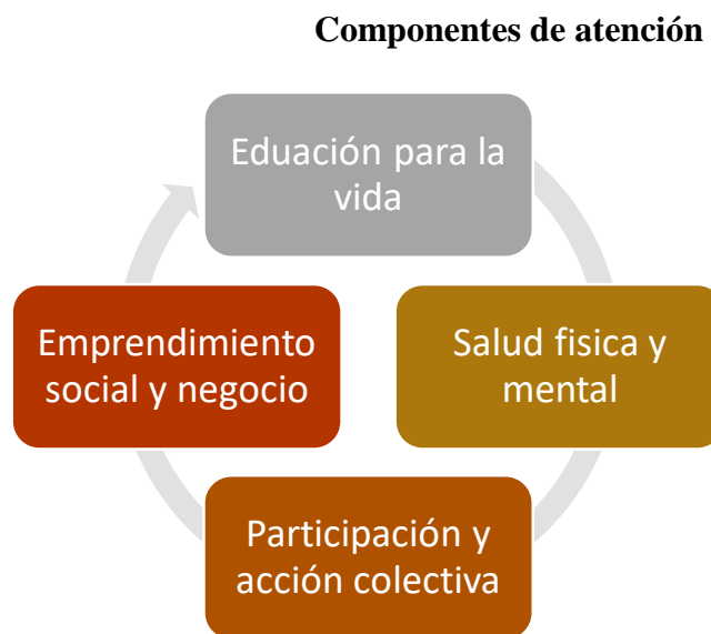
Tabla 1 Esquema de componentes de trabajo del programa

Atención integral a la niña y niño: parte del reconocimiento que posibilita el pleno ejercicio de los derechos de las niñas y niños; la potenciación de sus habilidades y capacidades desde 5 a 18 años de edad, brindando herramientas y condiciones mínimas para proporcionar el bienestar de la niña, niño, adolescente y joven. Por medio de abordaje en educación inicial, salud física y mental