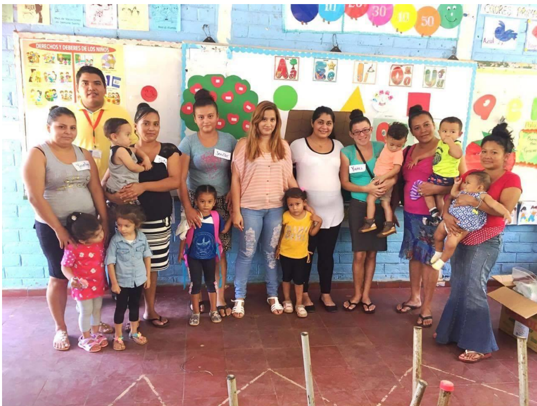
Imagen 8: Participantes en Círculo Familiar del Cantón El Piche