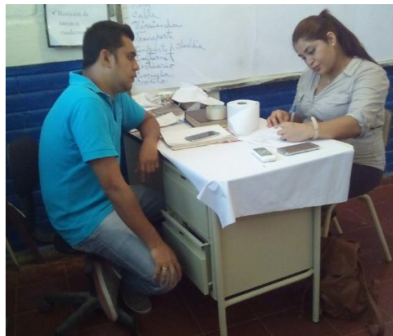
Imagen 13: Entrevista al ATPI del Cantón El Piche