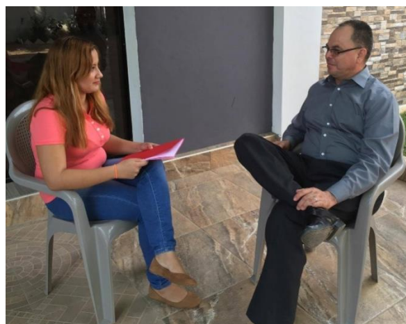
Imagen 19: Entrevista a Líder Religioso de Cantón El Piche