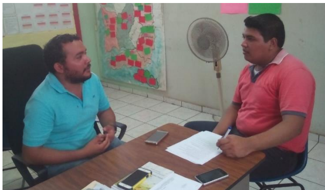
Imagen 14: Entrevista al ATPI del Cantón Olomega