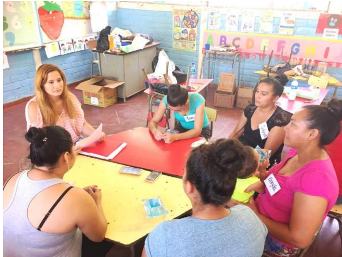
Imagen 7: Participantes en Grupo Focal Cantón El Piche