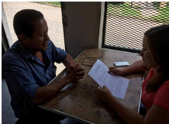
Imagen 17: Entrevista a Líder Comunal de Cantón El Piche.