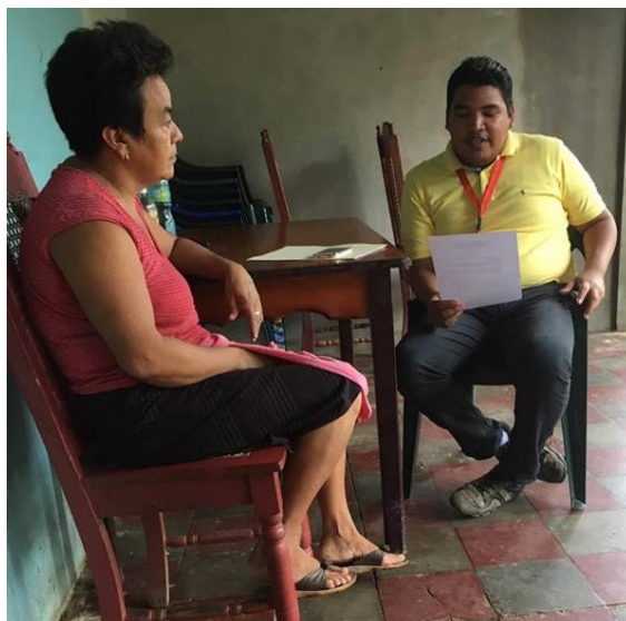
Imagen 18: Entrevista a Lideresa Comunitaria del Cantón Olomega