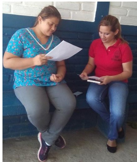
Imagen 12: Entrevista a la ATPI del Cantón El Gavilán