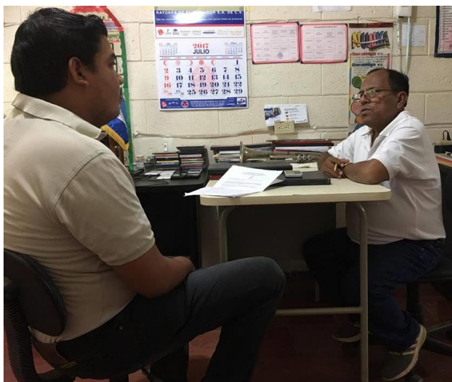
Imagen 21: Entrevista a Director del Complejo Educativo del Cantón Olomega