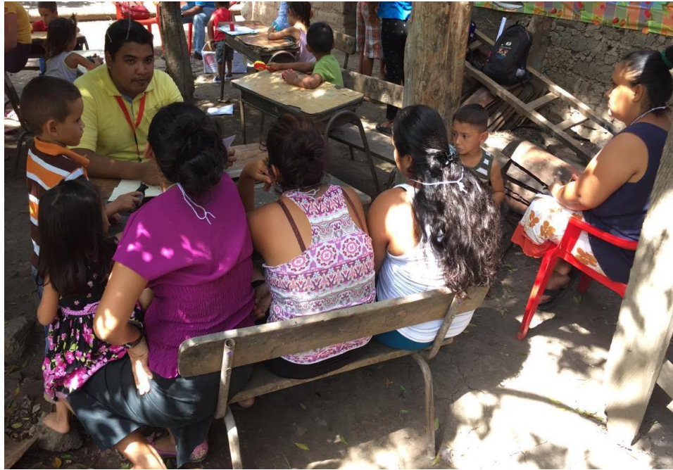
Imagen 3: Participantes Grupo Focal en Cantón Olomega