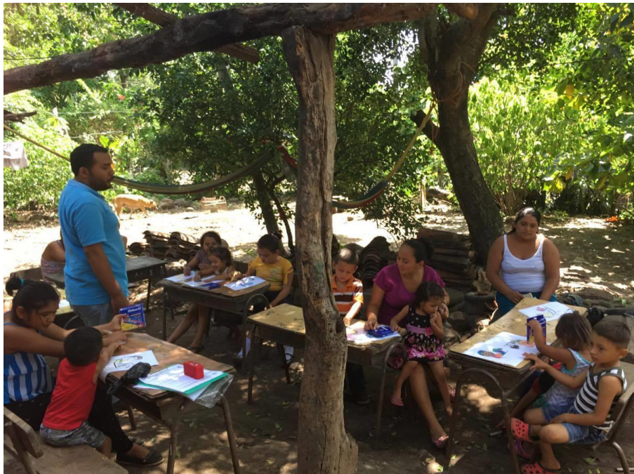
Imagen 4: Círculo de Familia en Cantón Olomega.