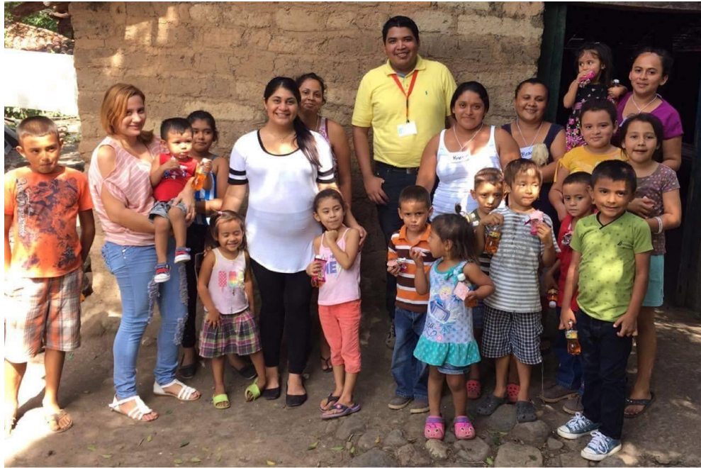
Imagen 5: Participantes del Grupo Focal en Cantón Olomega