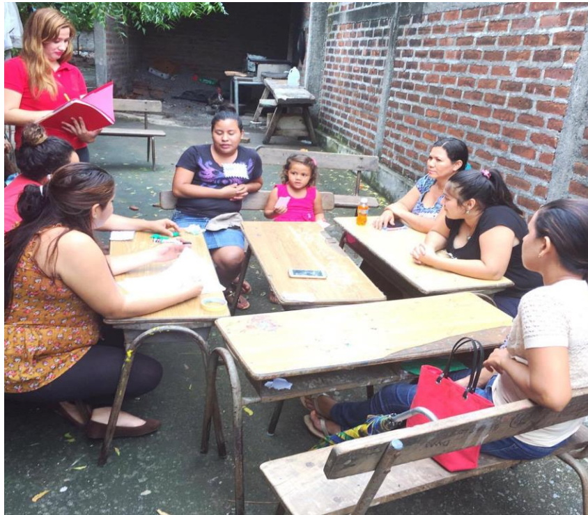
Imagen 1: Desarrollo de Grupo Focal en el Cantón El Gavilán