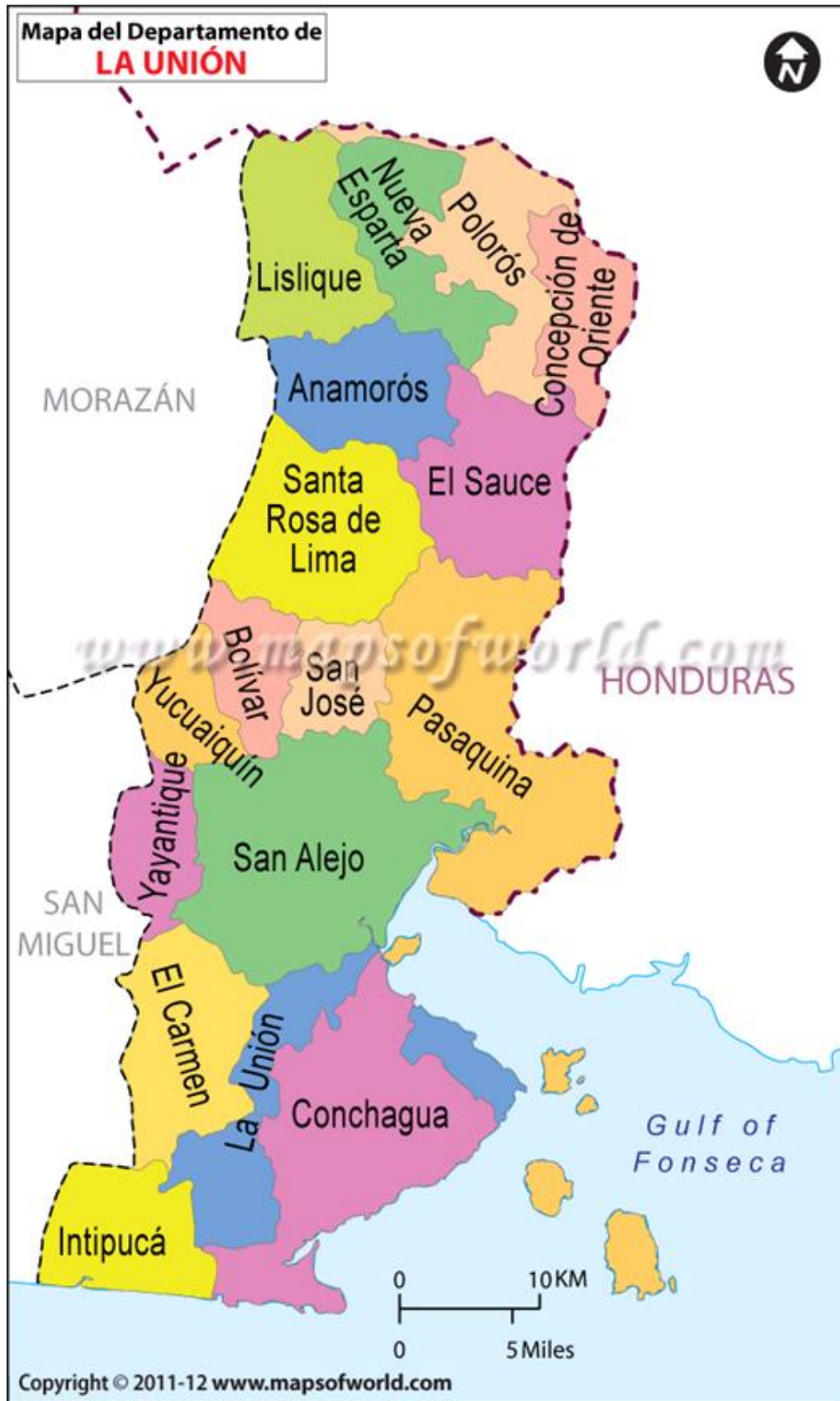
Ilustración 3: Mapa del Departamento de La Unión