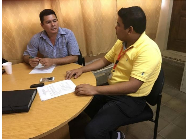
Imagen 11: Entrevista al Coordinador Departamental del Programa