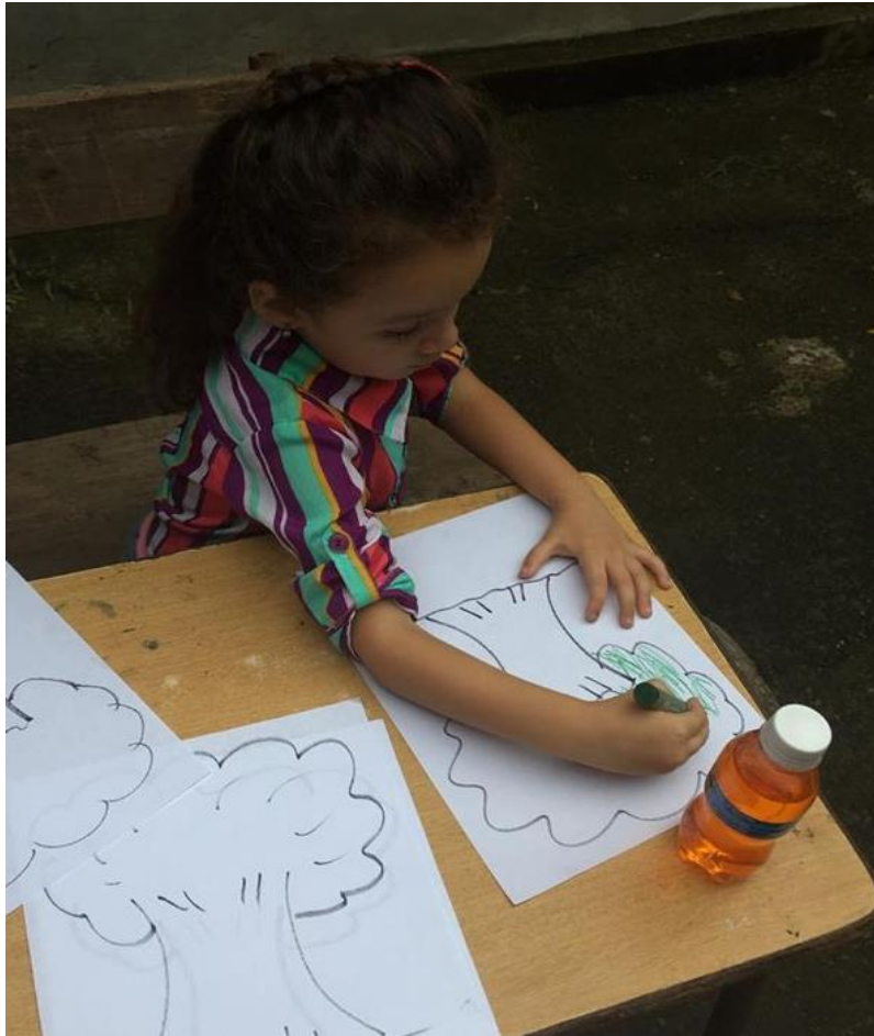
Imagen 9: Niña participante de círculo familiar de Cantón El Gavilán desarrollando actividades motrices.