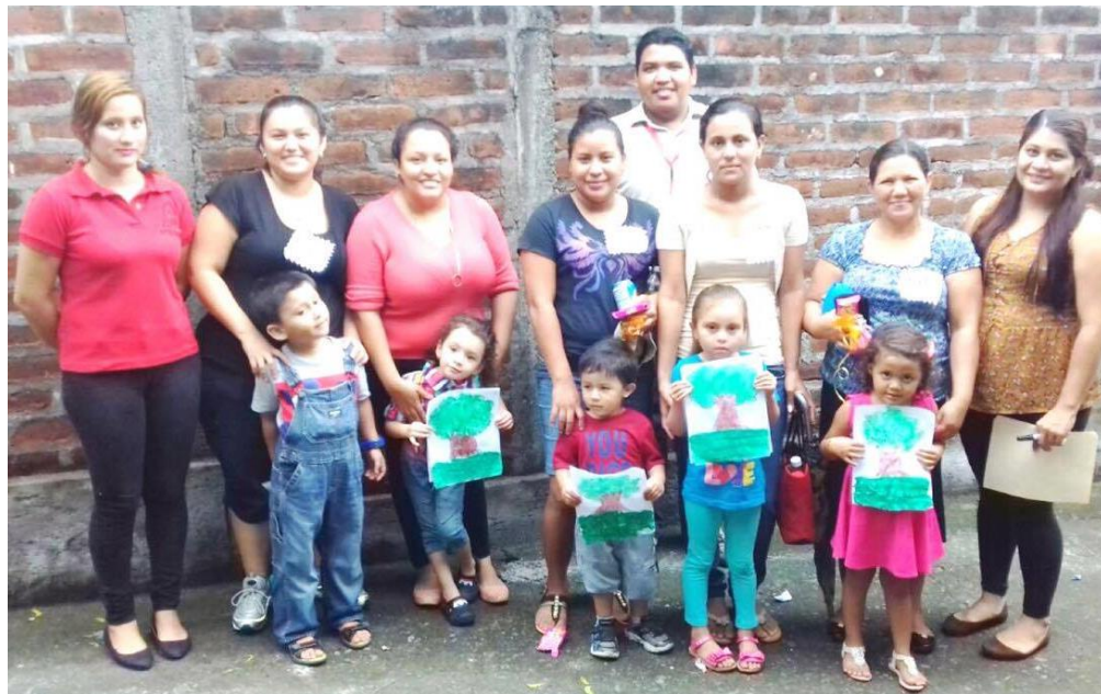
Imagen 2: Participantes de Círculo Familiar en Cantón El Gavilán.