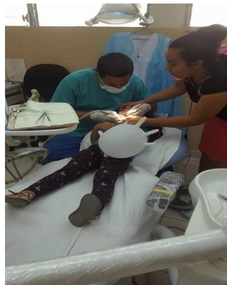
Imagen 10: Niños del Cantón El Piche Participando en Jornada Odontológica