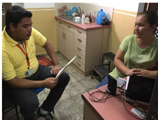
Imagen16: Entrevista a Representante de Unidad de Salud de Cantón Olomega.