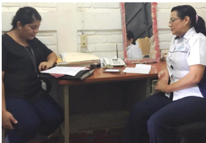
Imagen 20: Entrevista a Directora del Complejo Educativo del Cantón El Piche