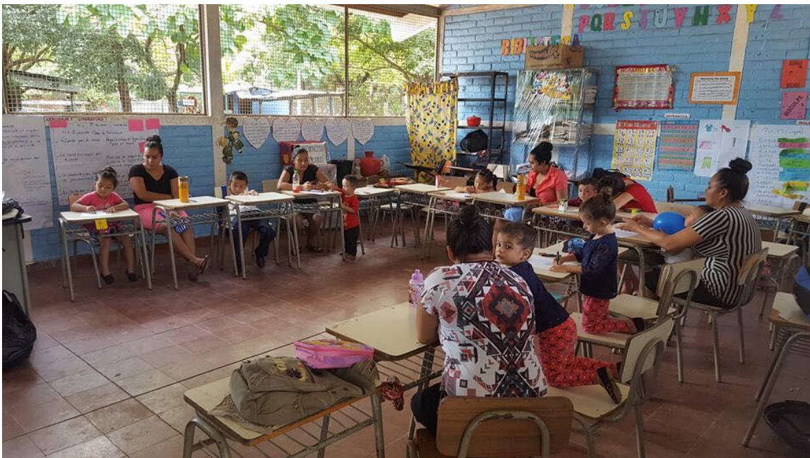
Imagen 6: Círculo Familiar en Cantón El Piche