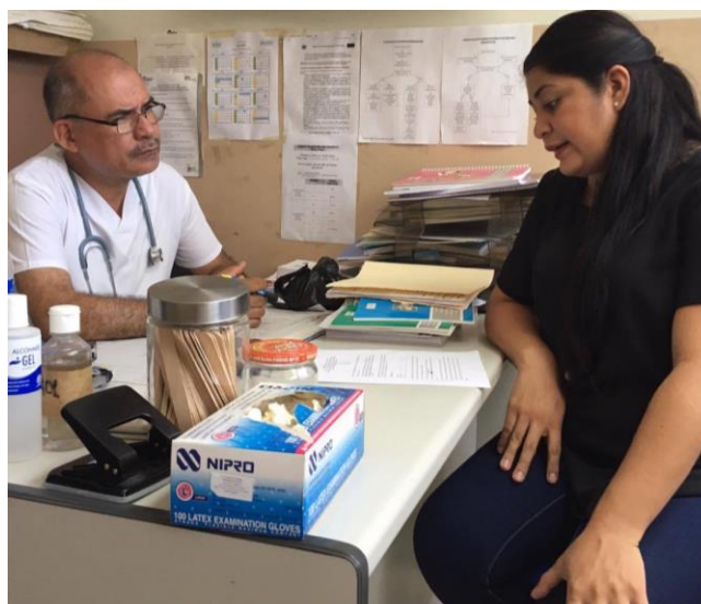
Imagen 15: Entrevista a Doctor de Unidad de Salud del Cantón El Piche.