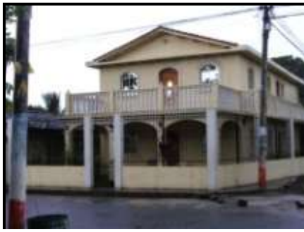
Casa de la Col. Reubicación Núcleo Nº 2, foto propia, tomada durante observación no participante, 8 de julio de 2010.

Actualmente, la Colonia Reubicación Núcleo 2 cuenta con 1,461 habitantes (Ver anexo 1), de los cuales 714 son mujeres y 747 son hombres. Los que habitan en 16 polígonos que conforman la Colonia, Reubicación Núcleo Nº 2 y cada uno de dichos polígonos tiene aproximadamente 25 casas (Ver anexo 2).