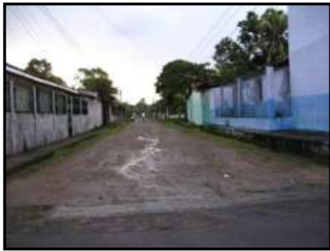
Falta de pavimentado en el Polígono, foto propia, tomada durante observación no participante, 8 de julio de 2010.

Por otra parte, la ADESCO en conjunto con la Alcaldía pretende pavimentar los polígonos que faltan de la Colonia y gestionar la adquisición de medicamentos para ofrecer una mejor atención de salud. De igual manera, la Alcaldía en futuros proyectos está valorando la instalación de tuberías de aguas negras.