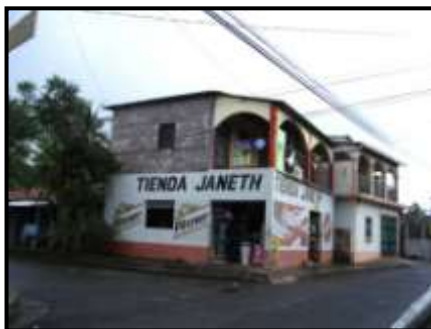
Tienda Janeth, foto propia, tomada durante observación no participante, 8 de julio de 2010.

Además, cuentan con el servicio de tren de aseo de la Alcaldía de Chalatenango, el cual se detiene frente a la fachada de la casa de esquina de cada polígono, asimismo tienen el servicio de alumbrado público, para éstos servicio la gente paga $67.00 dólares anuales.