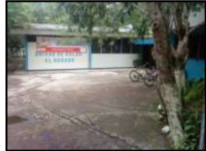
Unidad de Salud El Dorado, foto propia, tomada durante observación no participante, 8 de julio de 2010.

En relación a la salud, en el lugar existe una Unidad de Salud, la cual brinda atención los días de semana, fines de semana y días festivos, estos dos últimos a través de FOSALUD. Entre las primeras causas de consulta, según el registro diario de interés epidemiológico se encuentran de mayor a menor 10 : Infecciones respiratorias agudas (IRAS), infecciones de las