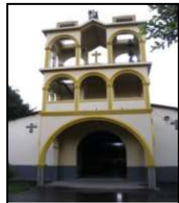
Iglesia Católica, foto propia, tomada durante observación no participante, 8 de julio de 2010.

En cuanto a la dimensión cultural, en lo religioso, la mayoría de los/as habitantes profesan la religión católica 12 . El 14 de enero celebran las fiestas en honor a su copatrono San Antonio y los días 13, 14 y 15 de octubre celebran sus fiestas patronales en honor a “Santa Teresa de Jesús”, donde se realizan varias actividades religiosas como: una novena, procesiones y misa. Por otra parte se desarrollan eventos artísticos patrocinados por la Alcaldía Municipal de Chalatenango.