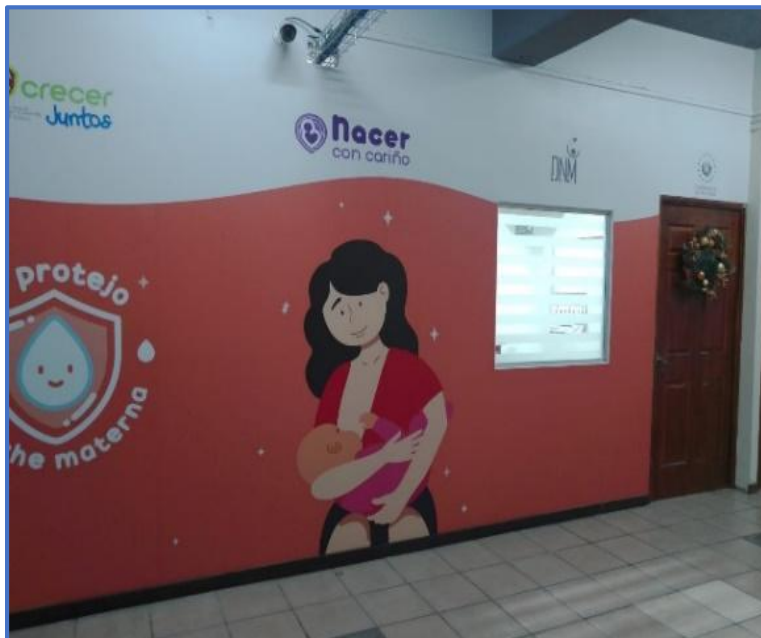
Fotografía 2: Clínica Empresarial de la DNM, lugar donde se generan la mayor cantidad de Desechos Bioinfecciosos de la institución.