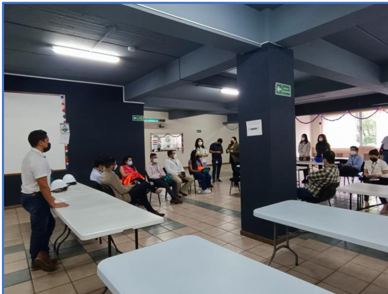
Fotografía 6: Socialización con el Comité de Seguridad y Salud Ocupacional de la DNM sobre las nuevas rutas de evacuación en caso de sismos.