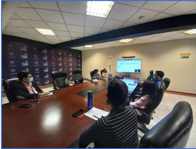
Fotografía 5: Socialización con el Comité de Gestión Ambiental y Eficiencia Energética (actores internos) para la implementación del PMI.