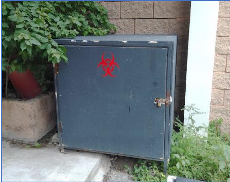
Fotografía 3: Evaluación del almacenamiento temporal de los Desechos Bioinfectivos conforme a lo requerido por la legislación aplicable para la elaboración del PMI.