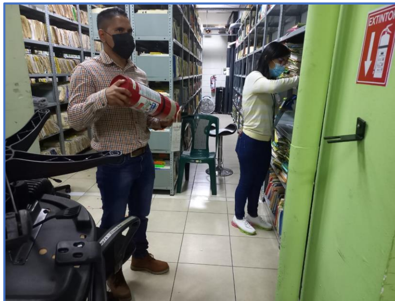
Fotografía 4: Revisión de la presión de los extintores distribuidos en la DNM.