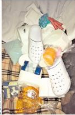
Paquetes. Familiares y amigos llevan paquetes a Alessandra, pero no saben de ella.

“Se han escuchado casos de mujeres trans que las detienen, les piden el celular y si les encuentran fotos íntimas vienen los militares y se envían las fotos, les quitan el celular o en muchos casos llegan hasta abusos sexuales. Conozco el caso de una mujer trans que no le encontraron pruebas y salió (de la cárcel), pero todos los días los militares la van a acosar donde ella tiene su trabajo”, denunció la psicóloga.