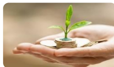
Figura 3. Dimensiones de la sostenibilidad