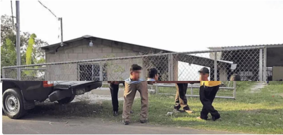
Noticiero LPG 21 de abril: Tres reos del penal de Izalco han muerto vapuleados

LPG Por La Prensa Gráfica 22 DE ABRIL DE 2022 19:08 HS - GMT-6