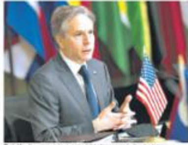
Pandillas. El secretario de Estado de Estados Unidos a respaldar los derechos humanos.

El funcionario también reiteró su llamado a que se respeten los derechos humanos y la libertad de prensa en El Salvador. "El Salvador es un país que se preocupa por los derechos humanos y la libertad de prensa", agregó.