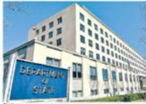
El informe del Departamento de Estado sobre derechos humanos que se publica cada año en marzo.

E l Departamento de Estado de Estados Unidos publicó ayer su informe anual sobre los derechos humanos en el mundo. El informe, que se publica cada año, destaca los abusos de derechos humanos que se cometieron en el mundo durante el año pasado. Entre los países que se mencionan en el informe se encuentran Cuba, China, Corea del Norte, Egipto, Etiopía, Irán, Myanmar, Omán, Arabia Saudita, Siria, Tailandia, Turquía, Vietnam y Yemen.