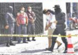
Prague, Chile. Defensores de derechos humanos en un momento de la presentación de un informe.