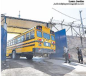
Barcelonnette, hacia el 6 de febrero de 2013, hacia 26 años que debería estar en funcionamiento.

ESPECIALISTAS EN LA TEMÁTICA ESTIMAN QUE NUEVA NORMA NO BUSCA MEJORAR LOS CENTROS PENITENCIARIOS, POR EL CONTRARIO, ANALIZAN QUE ESTA INTENTA LIMITAR LA TRANSPARENCIA Y EVADIR PROCESOS DE OTRAS LEYES.