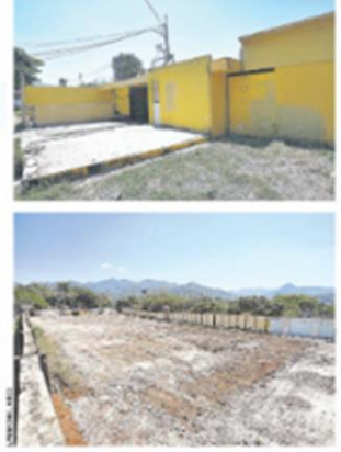
1. No se ha iniciado la construcción de los centros penales de Sonsonate, Matigüe y La Unión. 2. Se ha iniciado la construcción de los centros penales de Chalatenango y San Salvador.

4 CÁRCILES El Centro Penal de Sonsonate, el de Matigüe y el de La Unión continúan sin haber comenzado su construcción. Solo se han iniciado las obras de los centros penales de Chalatenango y San Salvador.