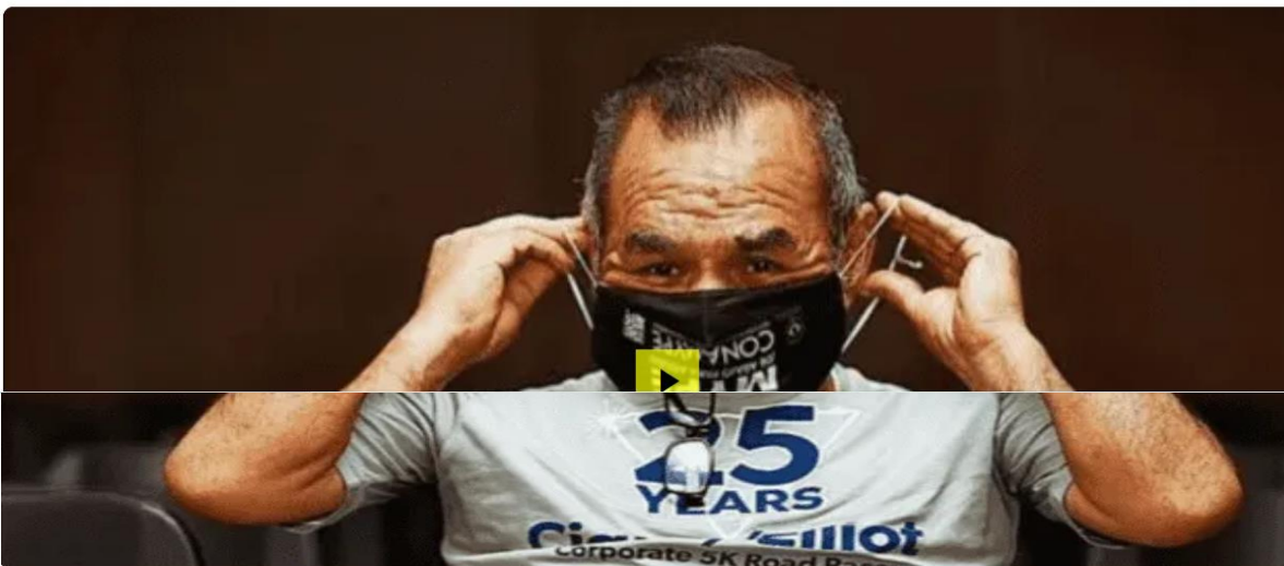
Noticiero LPG 5 de abril: Cámara deja en libertad a colaboradores de la MS-13

LPG Por La Prensa Gráfica 06 DE ABRIL DE 2022 21:50 HS - GMT-6