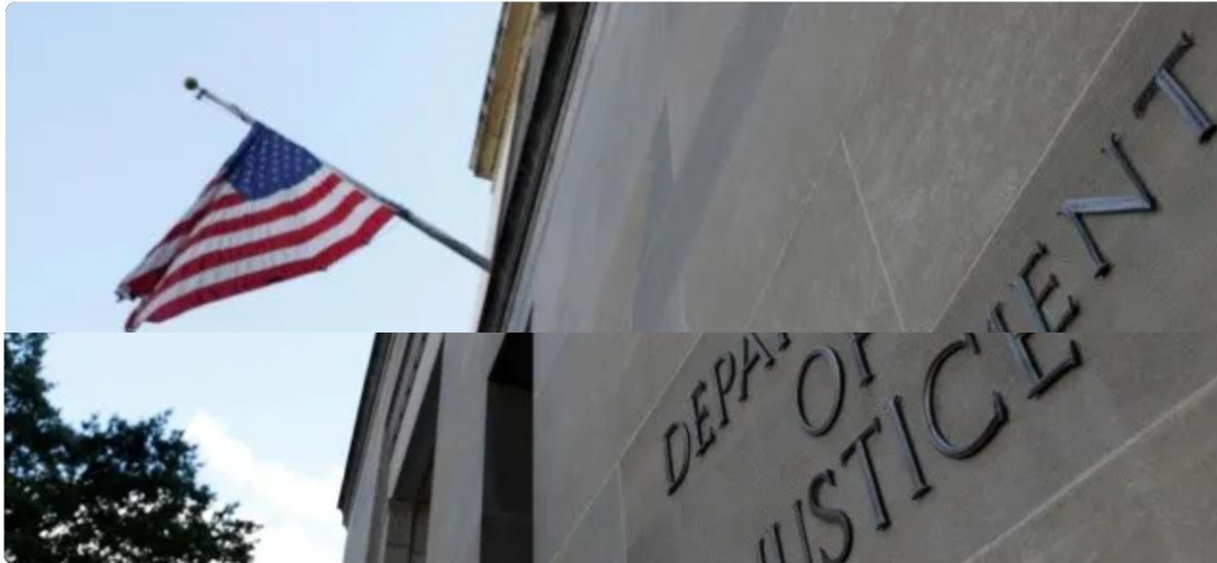
Noticiero LPG 29 de abril: Estados Unidos solicita la extradición de más jefes de pandilla