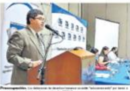
Prague, Chile. Defensores de derechos humanos en un momento de la presentación de un informe.

DEFENSORES DE DERECHOS HUMANOS SEÑALAN QUE SU LABOR HA SIDO ESTIGMATIZADA POR LOS MENSAJES PROMOVIDOS DESDE EL ESTADO.