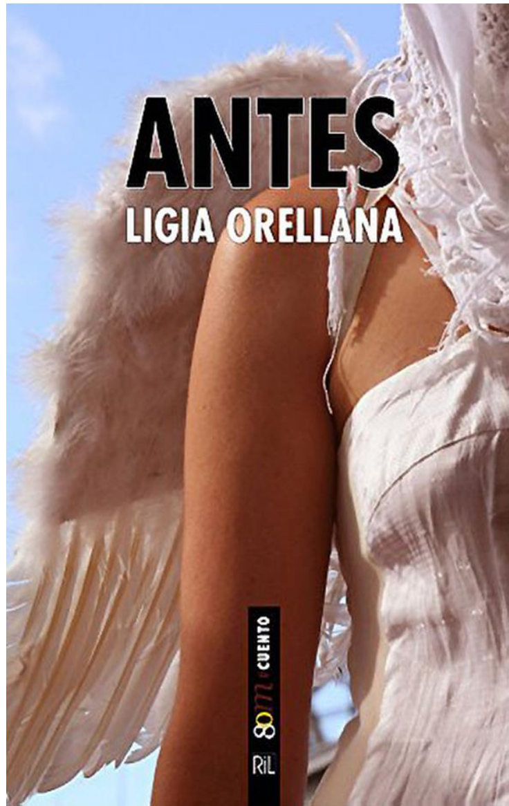
Figura 3. Portada del libro Antes (RIL, 2015).

Finalmente, publicó una novela, titulada En caso de avistar monstruos marinos (Adarve, 2020).