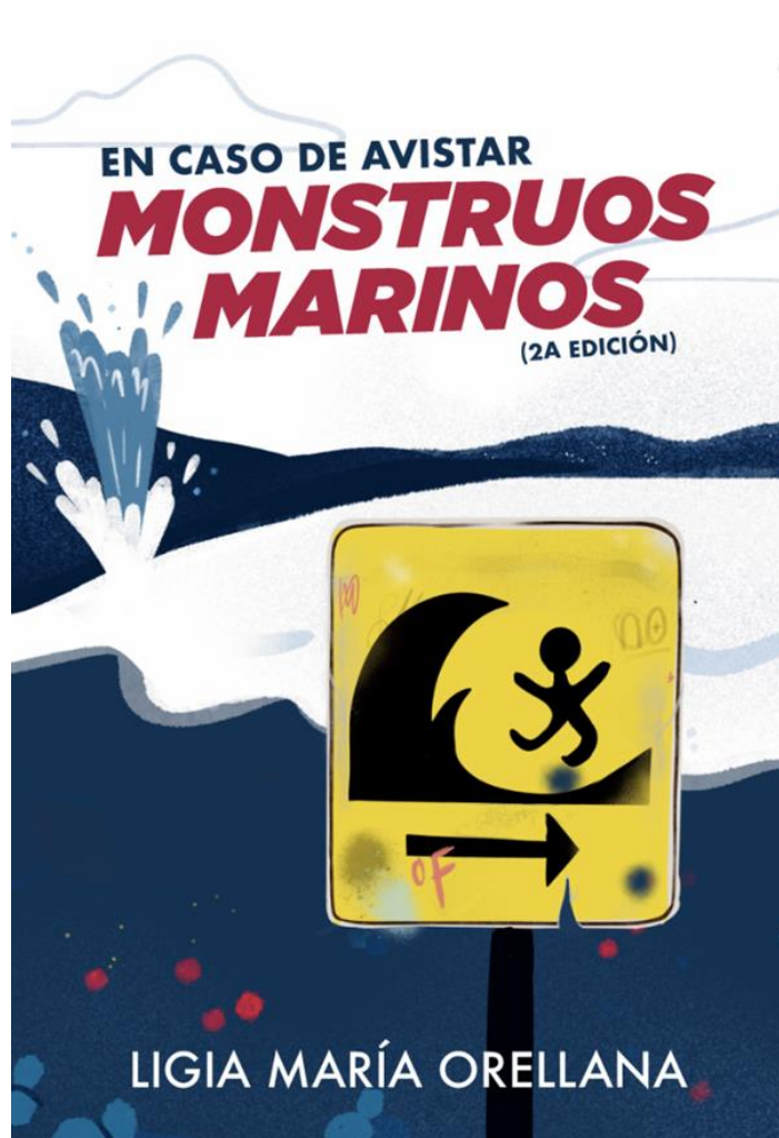
Figura 4. Portada del libro En caso de avistar monstruos marinos (Adarve, 2020).