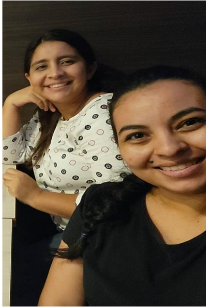
Fotografía 1: Investigadoras al inicio del proceso de investigación