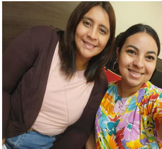
Fotografía 4: Investigadoras al final del proceso de investigación