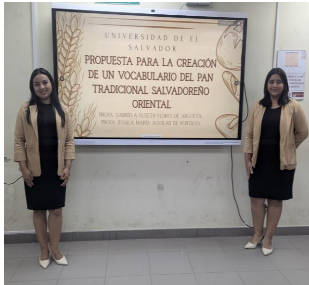
Fotografía 5: Investigadoras exponiendo los resultados de la investigación en las instalaciones de la Universidad de El Salvador, Facultad Multidisciplinaria Oriental