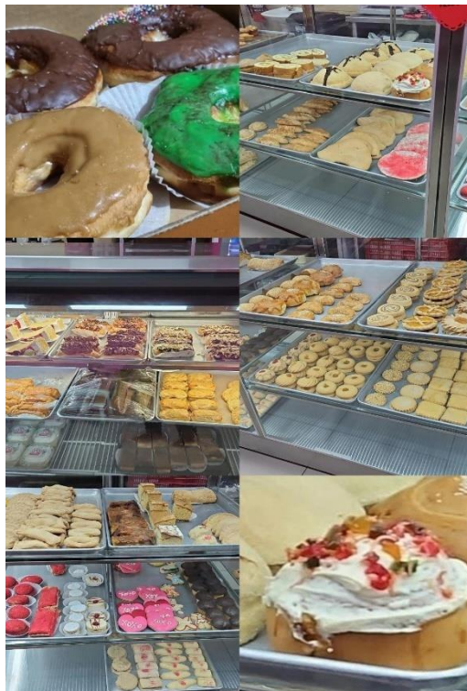
Fotografía 2: Muestras de pan dulce en panaderías comerciales