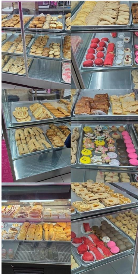
Fotografía 3: Muestras de pan dulce en panaderías comerciales