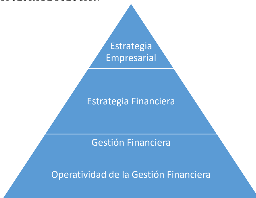
Figura 2 Esquema de la Propuesta de Solución