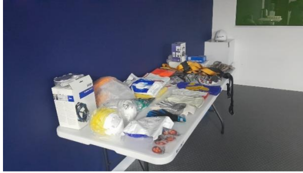
Fotografía 5: Apoyo en el montaje de stand para capacitación de uso de Equipo de Protección Personal.