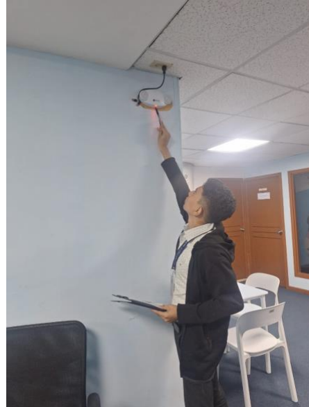
Fotografía 2: revisión de lámparas de emergencia.