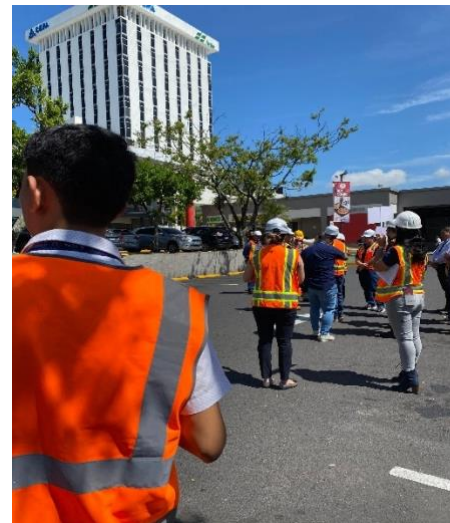
Fotografía 4: apoyo en el simulacro nacional de octubre.