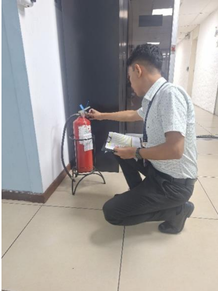
Fotografía 1: revisión de extintores