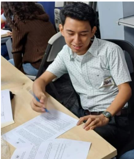
Fotografía 3: apoyo en la planificación de actividades del programa de sueños a bordo