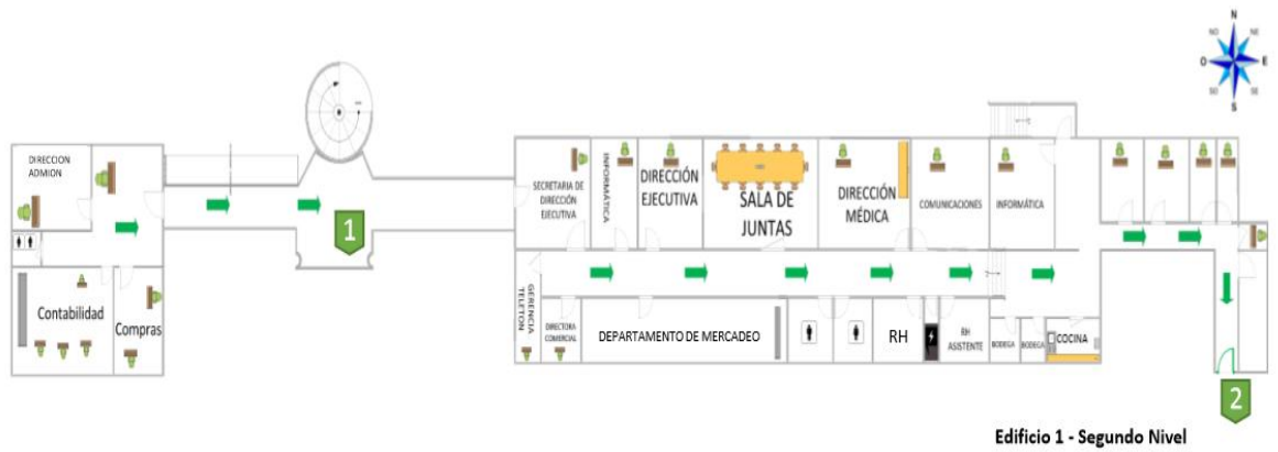
Edificio 1 - Segundo Nivel