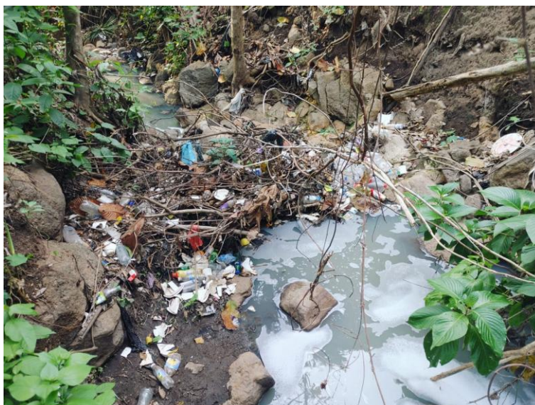
Figura N° 2. Contaminación por desechos sólidos en río Shutia La Libertad Oeste; Distrito de Sacacoyo.

La contaminación del agua es un problema que afecta a todos, ya que pone en riesgo la salud de las personas y la vida silvestre. La escasez de agua dulce es una realidad cada vez más preocupante, esta situación se agrava debido a que, se contaminan las fuentes de agua y las vuelve peligrosas para el consumo humano, representando una amenaza para la salud pública y una carga para los sistemas de salud.