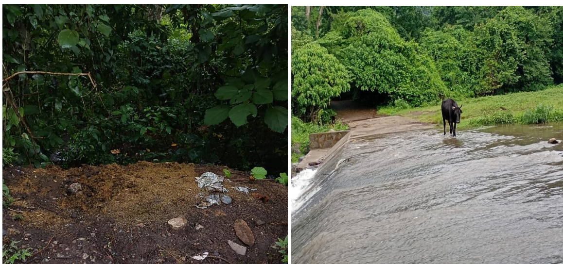
Figura N° 3. Materia orgánica de la actividad ganadera de la zona aledaña al río Shutia.

Durante las lluvias, los contaminantes presentes en el suelo de las áreas ganaderas, como estiércol y fertilizantes, pueden ser arrastrados al río por medio de la escorrentía. En las áreas ganaderas, el estiércol y los fertilizantes utilizados en el suelo contienen bacterias, nitratos, fósforo y otros contaminantes químicos. Esta contaminación hídrica puede provocar la proliferación de algas, la disminución del oxígeno en el agua y la presencia de patógenos, lo que afecta la calidad del agua y puede poner en riesgo la salud humana, causando enfermedades gastrointestinales y problemas en la piel.