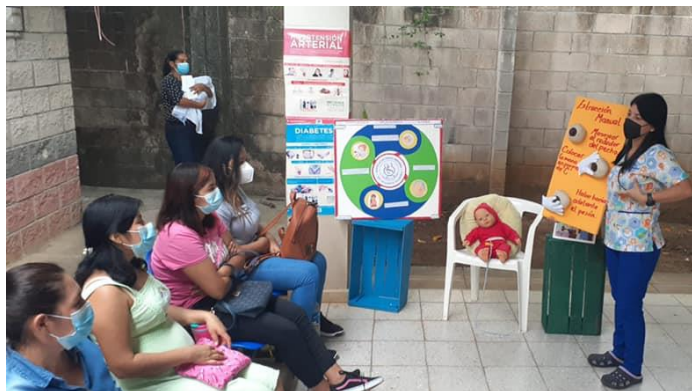
Figura 9. Celebración del día mundial de la donación de leche