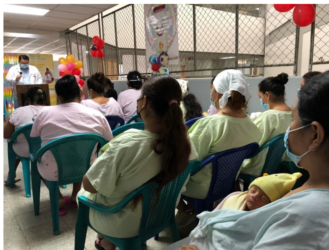
Figura 10. Celebración del Día Mundial y Nacional de la Donación de Leche Humana.