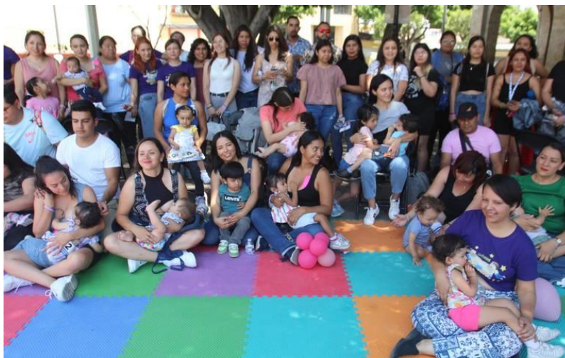
Figura 3. Mini tetada para crear conciencia a la población.