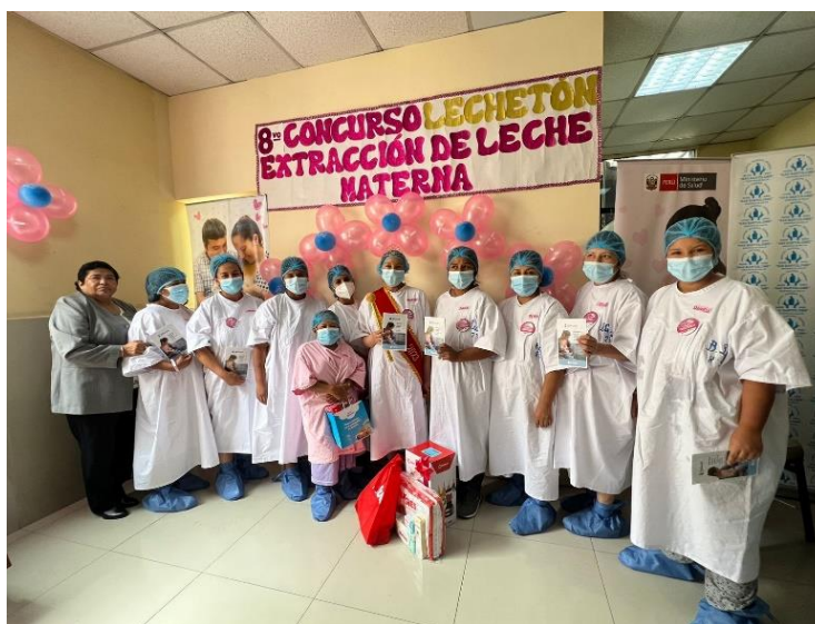
Figura 2. Lechetón 2023 “Maratón de Extracción de Leche Materna”