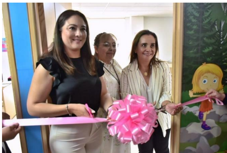
Figura 4. Inauguración de la Sala de Lactancia No. 15 en el CEREDI.

En el BLH del Hospital Materno-Infantil de Durango en agosto de 2023 en el marco de la conmemoración de la Semana Mundial de la Lactancia Materna, la secretaria de Salud Irasema Kondo Padilla, realizó la primera “Charlas de café con leche” en donde estuvieron resolviendo todos los mitos que existen acerca de la LM, reiterando a los asistentes la importancia de contar con espacios para lactar y que, por parte de los jefes, se pueda dar un espacio a las madres que realicen este proceso, por lo que inauguró la sala de Lactancia Materna en el Centro Regional de Desarrollo Infantil (CEREDI) del Hospital General de Durango. (37)