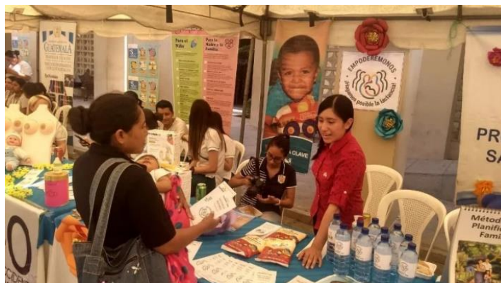
Figura 6. Zacapa promueve la Lactancia Materna.