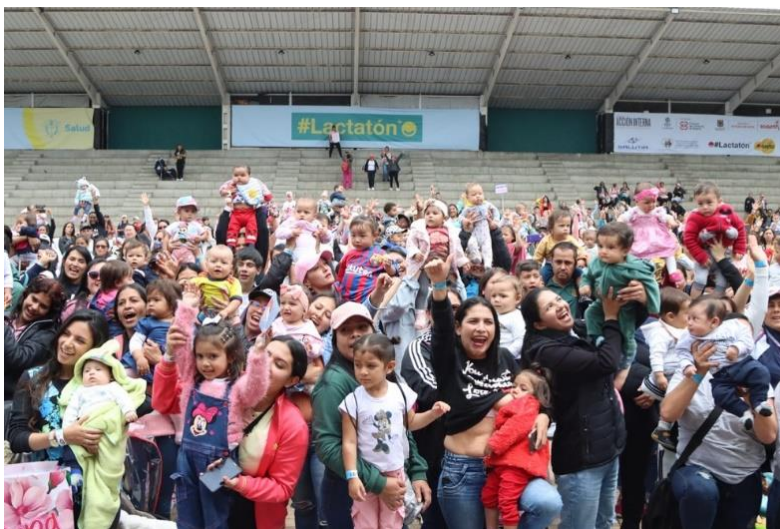
Figura 1. Lactatón 2023 reunió a 2.200 madres gestantes y lactantes en Bogotá.