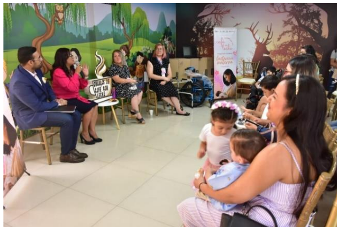
Figura 5. Inauguración de la Sala de Lactancia No. 15 en el CEREDI.