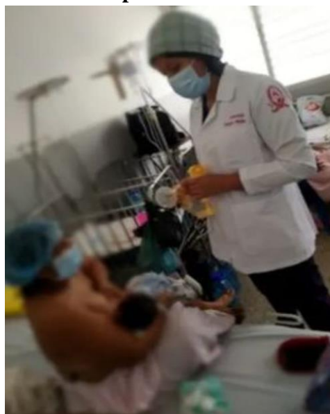
Figura 11. Asesoría a madre sobre la importancia de la lactancia materna y sus beneficios.