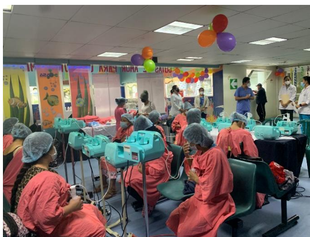
Figura 8. Hospital de Roosevelt celebra el día Mundial de la Donación de Leche Materna.