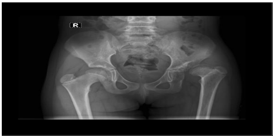
Figura 1: Radiografía de pelvis anteroposterior con aparición retrasada del centro de osificación de la epífisis femoral izquierda, ensanchamiento de la articulación coxofemoral y aplanamiento del acetábulo.

No se le indicó ningún tratamiento farmacológico ya que paciente no se quejaba de dolor pero si se le indicó una radiografía de pelvis anteroposterior ( Figura1 ), según lectura de médico radiólogo se muestra una aparición retrasada de centro de osificación de la epífisis femoral izquierda así como ensanchamiento de la articulación coxofemoral y aplanamiento del acetábulo, densidad ósea conservada, no se observan trazos de fractura, no hay lesiones líticas ni escleróticas, los espacios articulares sacroilíaco y coxofemoral derecho son de aspecto normal.